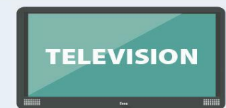
Linearni TV program