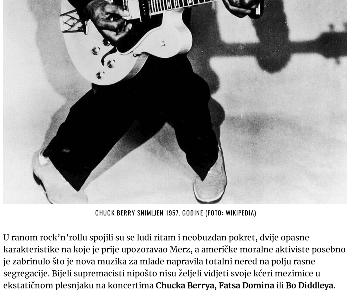
CHUCK BERRY SNIMLJEN 1957. GODINE

U njegovo doba bilo je malo gramofona i premalo ploča, Radio Zagreb tek je počinjao s emitiranjem, a atraktivni novi ritmovi mogli su se najprije čuti u plesnim salovima. Zato je Merzova agitacija protiv amoralnih pjesova upotunjena zahtjevom za zabranu štetnih muzičkih sadržaja. Ne iznenaduje što ondašnji crkveni velikodostojnici nisu podržali njegovu inicijativu. U odmjernjavaju snaga starog poretka i novih ideja zapadnjačka popularna plesna muzika iz 1920-ih nikako nije mogla prestativajati rešnu prijetnju ovjke kod nas, na periferiji zapadnog svijeta. Međutim, Merz je ispravno procijenio kako će ona imati dalekosežan utjecaj na buduće društvene odnose. Tridesetak godina kasnije čikaški kardinal Samuel Stritch zabranio je rock'n'roll u katoličkim školama svoje nadbiskupije i aktualizirao cenzuru moderne muzike i plesa.