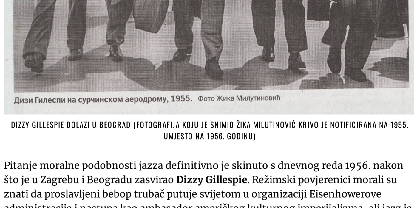
DIZZY GILLESPIE DOGAZI U BEOGRADU (FOTOGRAFIJA KUZI I ŠMIRO IJKA MILUTINOVIĆ KRIVO JE NOTIFICIRANA NA 1955. OBRUŠA NA 1956. GODINU)

Čuvati morala Titove Jugoslavije imali su vlastite prioritete, a domaća rock muzika nije bila na popisu naročito sumnjivih aktivnosti prije pojave Bubašokera . U najtežernom djelovanju Agitpropa – odjela za agitaciju i propagandu formiranog prema sovjetskom modelu i usmjeravanog direktivama CK KPJ, uvedene su trajne zabrane pučkih pjesama s jakim nacionalnom simbolikom koje su mogle zasmetati konceptu bratstva i jedinstva jugoslavenskih naroda, a izvođenje religioznih pjesama bilo je dopušteno samo u vjerskim objektima. Muzika američkog povijetka bila je kolektivna problematika, ali zbog jaza se nije išlo u zatvor kao zbog pjevanja ruskih pjesama poslije rezolucije Informbiroa.