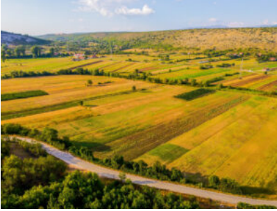
Petrovo Polje iz zraka

Mauzolej Ivana Meštrovića, koji se smjestio izvan Drniša kod Otavica, ne samo da je postao spomenik Meštrovićevom umjetničkom nasljeđu, već i podsjetnik na njegovu blisku povezanost s rodnom grudom. U njemu počivaju ostaci umjetnikove obitelji, a skulpture koje krasi unutrašnjost ovog tajanstvenog spomenika izražavaju duboke emocije i temeljne ljudske vrijednosti koje je Meštrović želio prenijeti kroz svoj rad. Grad Drniš, sa svojim šarmom i bogatom poviješću, ponosno čuva uspomenu na Ivana Meštrovića. Kroz muzeje, spomenike i kulturne događaje, grad slavi njegovu umjetničku ostavštinu i ističe važnost koju je imao za lokalnu i nacionalnu kulturu. Veza između Mauzoleja Ivana Meštrovića i grada Drniša nije samo geografska ili povijesna; to je veza duše, koja spaja umjetničku strast i ljubav prema rodnom kraju. Oboje ostaju svjetionici kulture i umjetnosti, podsjećajući nas da pravo bogatstvo leži u dubokim korijenima i autentičnosti.