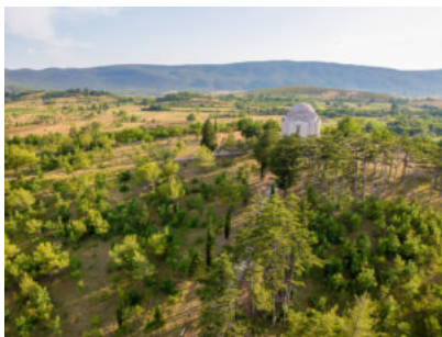
Crkva Presvetog Otkupitelja – Mauzolej Ivana Meštrovića iz zraka