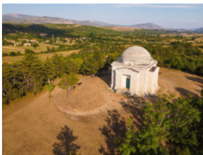
Crkva Presvetog Otkupitelja – Mauzolej Ivana Meštrovića iz zraka