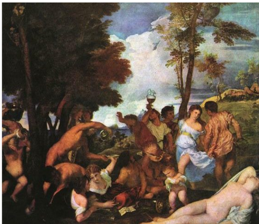
Tizian Bakanalija, Madrid, Prado

Objavio Hrvatska uživo u 26. srpnja 2023. Tagovi Kategorija