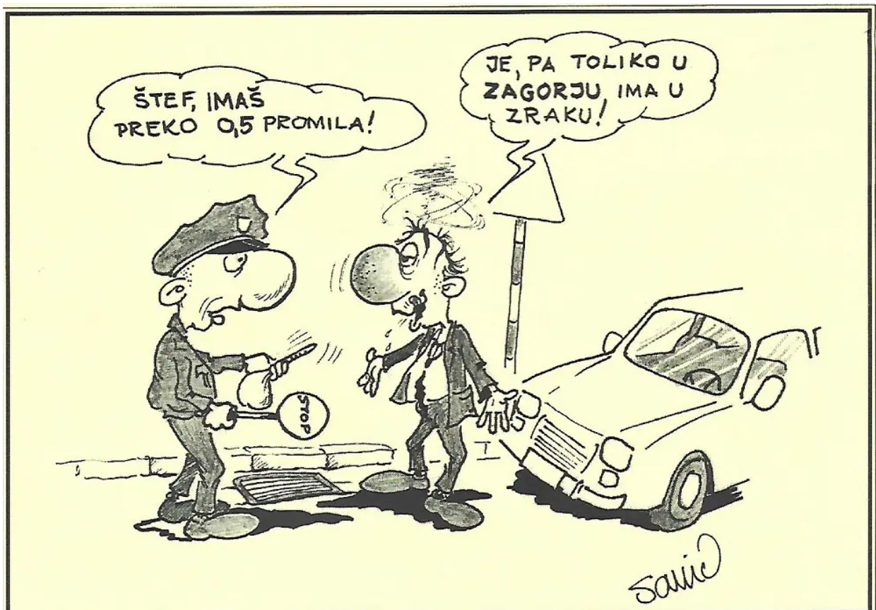
Autor: Mladen Savić

Za one koji vole smijeh, humor, satiru i sve ono što podrazumijeva duhovitost, to su zaista poticajne tvrdnje da ustrajemo u borbi za smijeh na ovim prostorima.