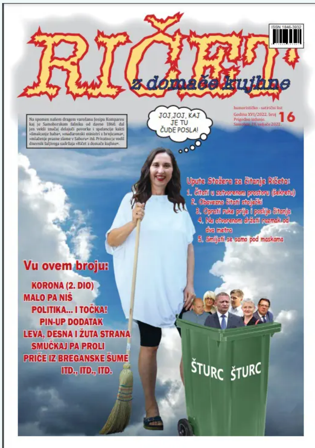
Samoborski fašnički humoristični list "Ričet"

„Zvonec“ i donjostubički „Zagorski Potepuh“. Uostalom, stari je običaj da čelni čovjek mjesta u te dane predaje ključeve grada princu karnevala.