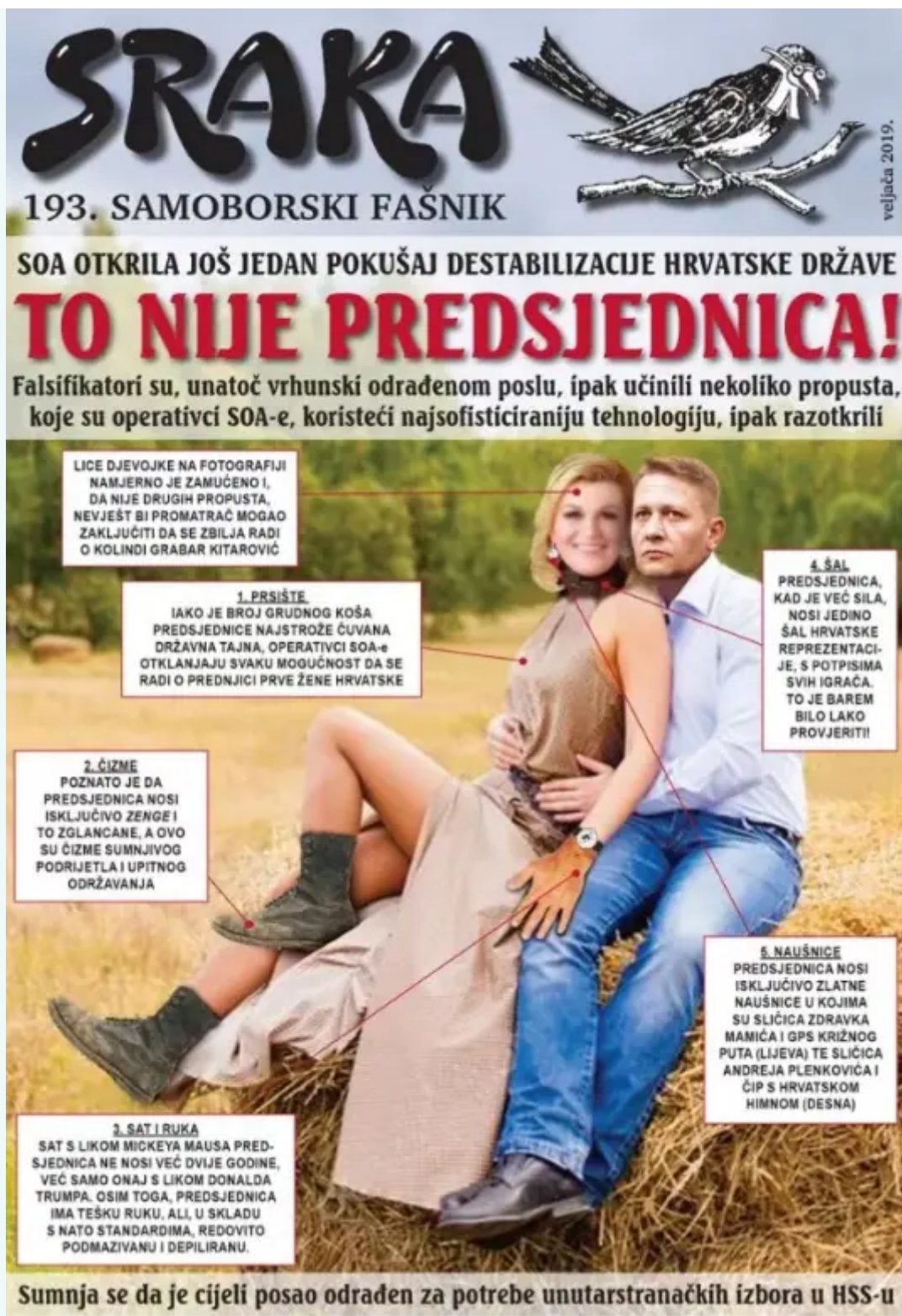
Samoborsko fašničko glasilo Sraka