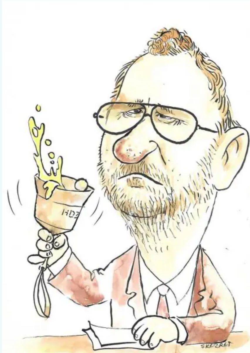
Autor: Krešimir Skozret

Važno je pitanje, mora li i šala imati svoju mjeru? Mnogi se smiju vicevima o gluhima, slijepima ili hromima. Smijati se na račun invaliditeta? Mislim da je to nepoželjna tema za šalu, pogotovo kad oko sebe imaš lažljive i pohlepne političare, tajkune i najrazličitije primjere gluposti, škrtosti, gramzljivosti i zloće na čiji se račun, ako ništa drugo, barem možeš nasmejati.