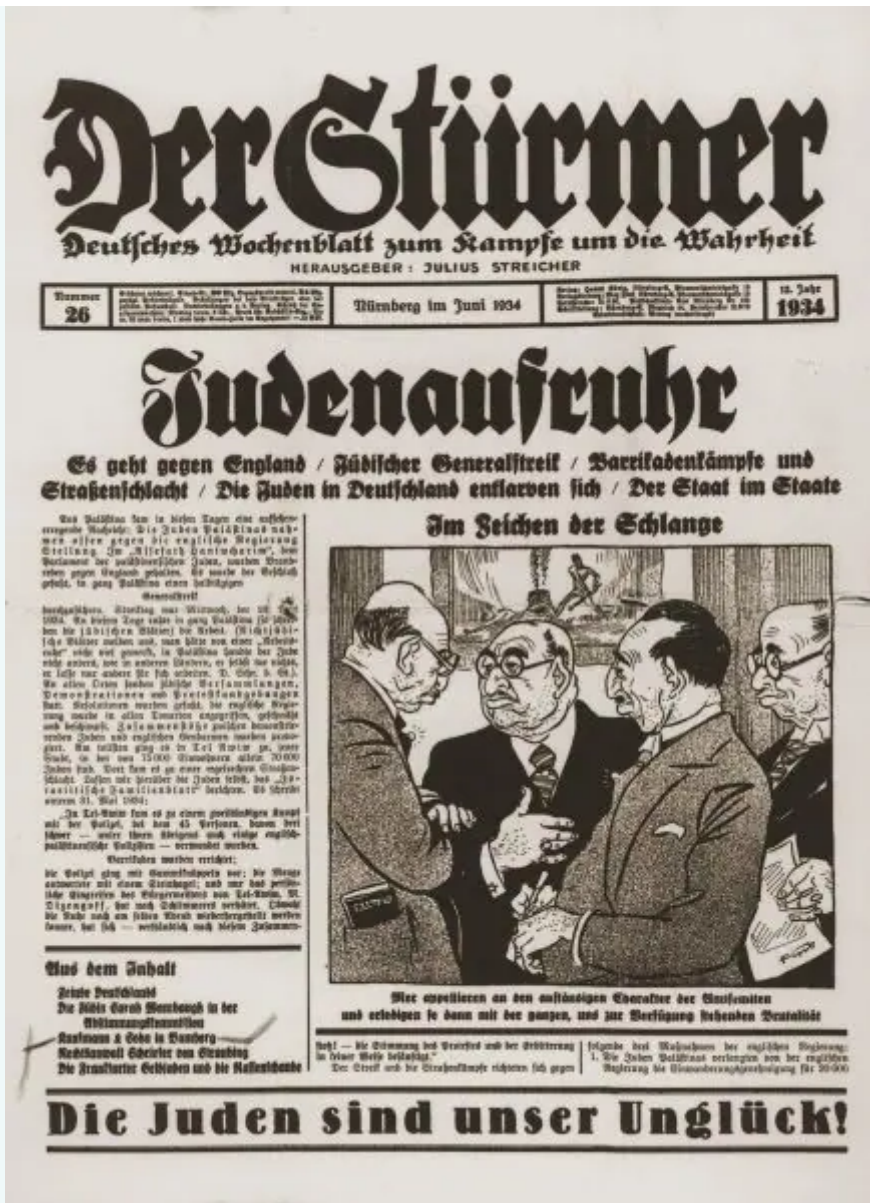
Karikatura Židova na naslovnici njemačkog tjednika "Udarnik" s apelom "Židovi su naša nesreća!" iz 1934. godine, jedna u nizu tada objavljivanih kojom se Nijemce pripremalo na progon Židova

Holokaust ima svoje začetnike u karikaturi. Prije masovnog progona Židova njemačke novine su godinama objavljivale karikature Židova kao bogatih i pohlepnih i kroz to pripremali Nijemce na progon Židova.