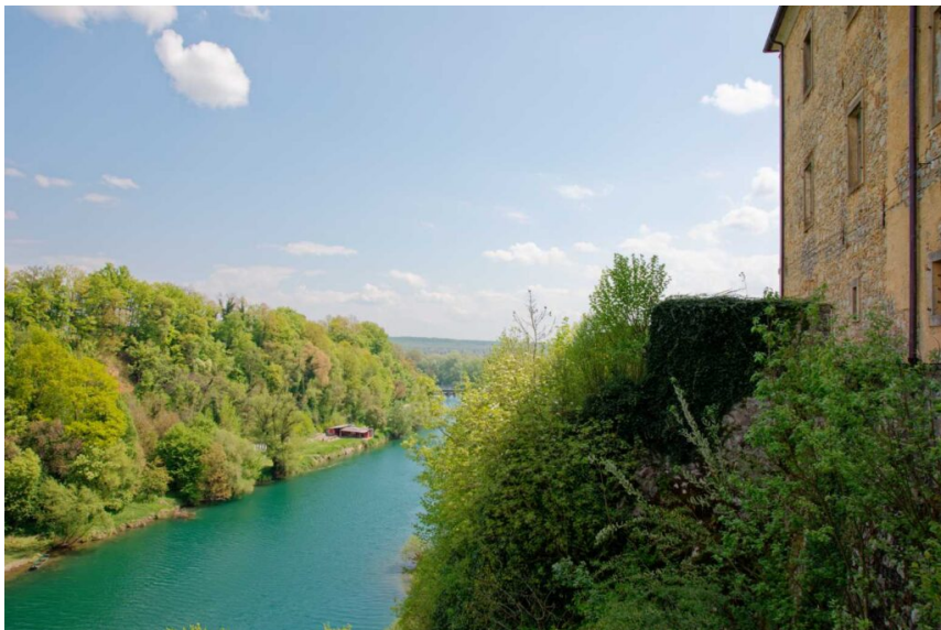
Pogled na Kupu

U srcu Hrvatske, okružen zelenim brdima i smirujućom rijekom Kupom, smješten je stari grad Ozalj. Ovaj povijesni dragulj ima bogatu prošlost koja seže unatrag tisućama godina te zrači šarmom svoje kulturne i prirodne baštine. Danas predstavlja važan spomenik prošlih vremena i centar kulturnog života u regiji.