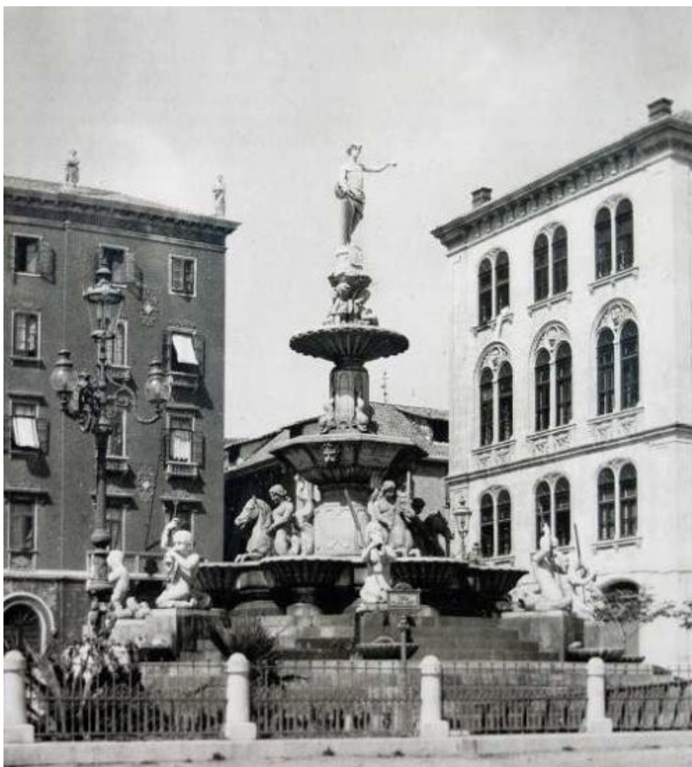
Kandelabar (ujedno se iznad krovnog vijenca palače Bajamonti vide dvije od četiri skulpture, alegorije Vrlina, nastale u Veneciji, a koje danas više nisu

Kako i sama fontana podjednako je važno i pitanje totala okolnog prostora jer utječe na doživljaj i fontane i mjesta. Kao dodatak povijesna je fontana imala četiri kandelabra, koji su bili raspoređeni u četiri kuta unutar pravokutne ograde. Krajobrazno rješenje uključivalo je i nekoliko palmi, koje također valja promisliti u kontekstu biljnih vrsta i cjeline, ali ne samo fontane, nego čitave rive. Kandelabri se nepotrebno previše nameću i uputno je razmotriti neku drugu opciju, i to ne samo zato što je javna rasvjeta na Rivi danas tretirana posve drugačije.