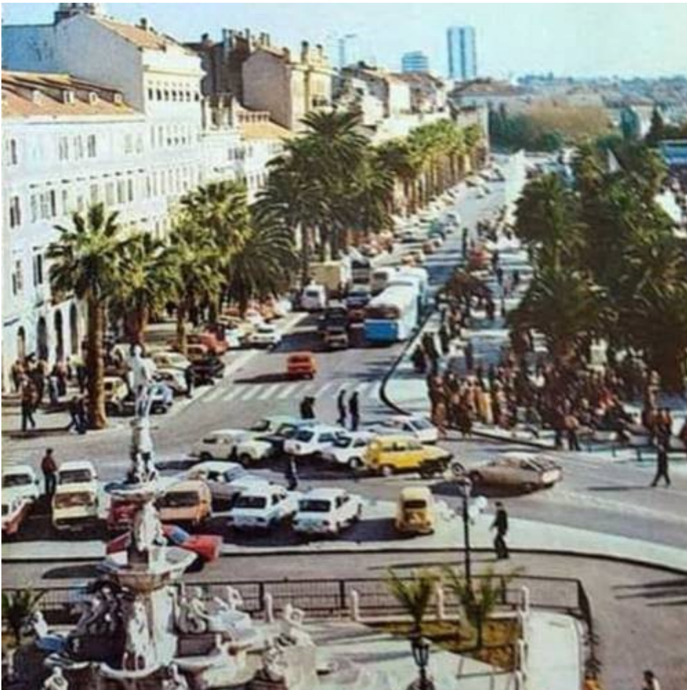
Gipsani model podignut 1979. za potrebe snimanja serije Velo misto

Kakvo god to rješenje bilo, bilo bi manjkavo tek kopirati fontanu točno onako kakva je bila, a ne računati sa zahtjevima suvremenosti i njezine bolje uklopljenosti u grad, vrijeme i potrebe ljudi. Istovremeno s određenim pojednostavljivanjem sklopa te izostavljanjem barijera i kandelabara, potrebno je logično sadržajno upotpunjavanje. Ona pritom ne treba biti tek reprezentacija, memento o prošlom, nego treba ne samo služiti društvenosti nego je i nuditi i poticati. Konačno, već je, primjerice, najavljena prilagodba grba grada jedna od takvih promjena. Ispunjavanje zahtjeva suvremenosti ne umanjuje vrijednost (povijesne) fontane, nego upravo suprotno, daje joj više smisla.