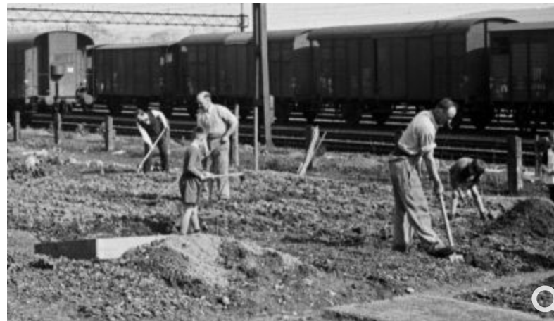
Sadnja krumpira na javnim površinama u Bernu tijekom Drugog svjetskog rata

Iako Švicarska već gotovo dva stoljeća nije vodila ratove, u toj se zemlji robne rezerve shvaćaju iznimno ozbiljno, jer u kolektivnoj memoriji građana još su živa sjećanja na razdoblja nestašica tijekom Drugog svjetskog rata kada su stanovnici na javnim površinama gradova sadili krumpir. Troškove skladištenja snose svi građani Švicarske , no oni su na prvu nevidljivi jer se dodaju potrošačkim cijenama pa tako svaki stanovnik za obavezne zalihe godišnje izdvoji oko 15 franaka. I dok se kod nas na popisu strateških robnih zaliha nalazi Vegeta, u švicarskim robnim zalihama neizostavna je - kava. Unatoč tome što nema pravu nutritivnu vrijednost, kava pospješuje produktivnost i pomaže u stresnim situacijama - što krize i nestašice svakako jesu - i zato, zaključili su Švicarci, ostaje do daljnjega obavezan dio kriznih zaliha.