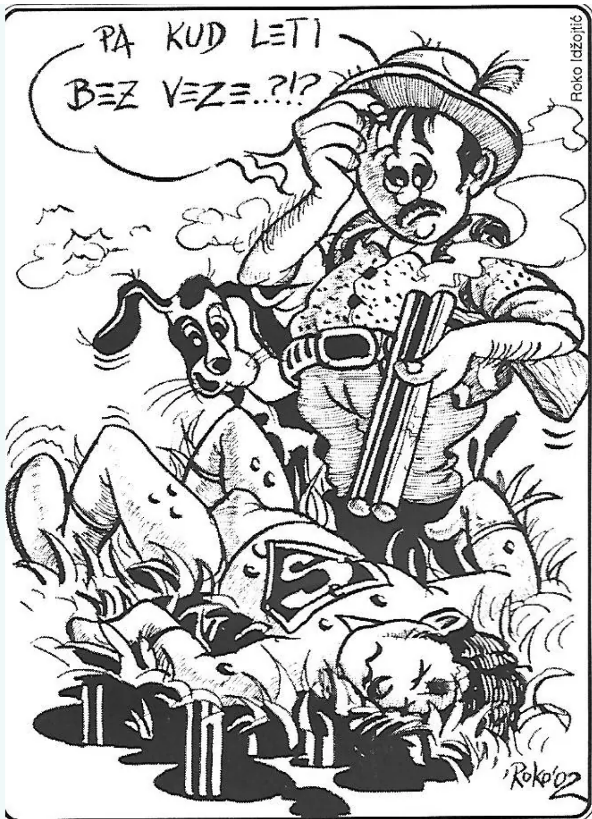
Autor: Roko Idžijotić