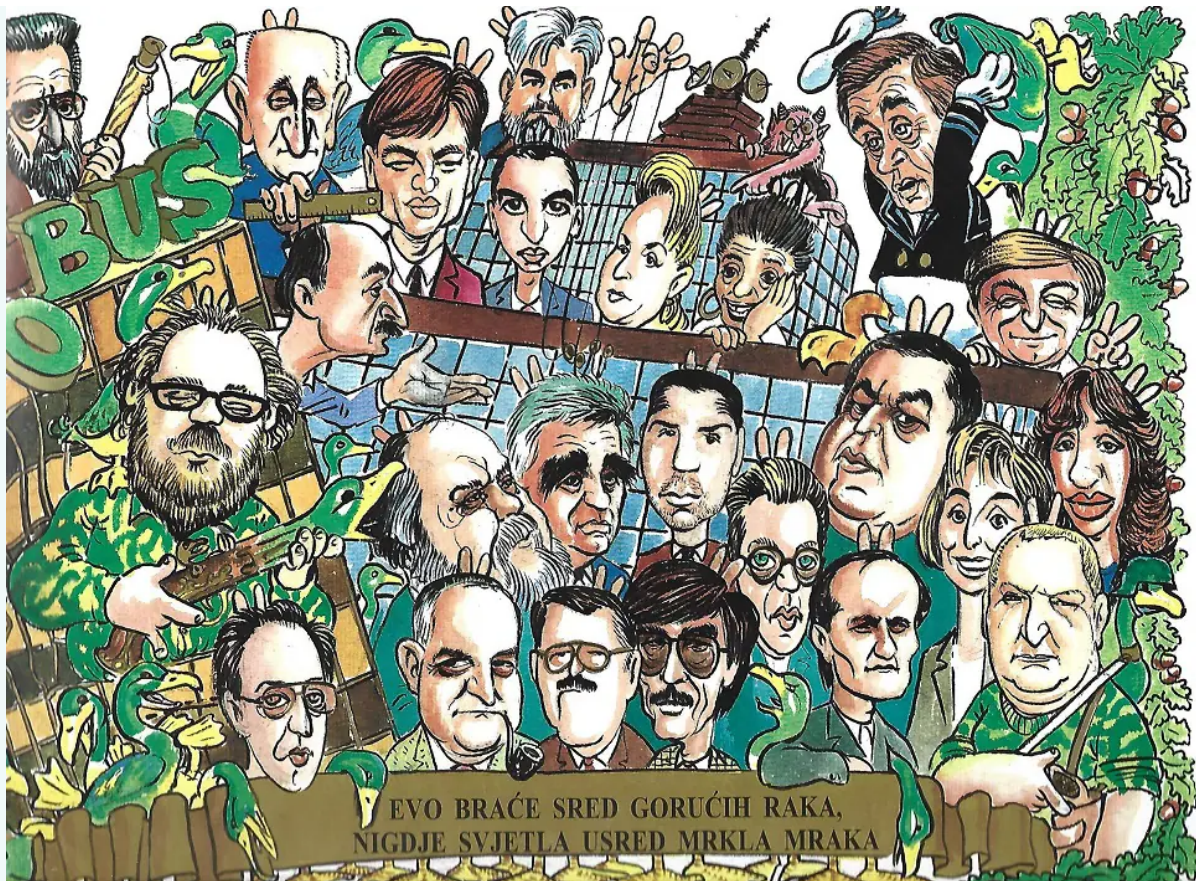
Autor: Krešimir Skozret

Na kraju, i novinarima se smiju. Zar ne!