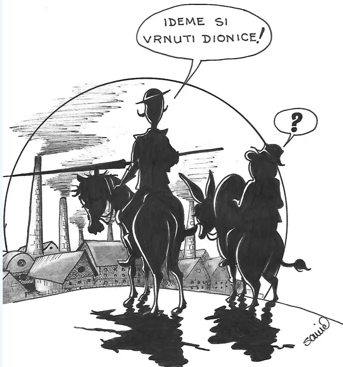
Autor: Mladen Savić

Ministarstvo kulture, odnosno njihov odjel za nakladničku djelatnost dosad baš nije bio sklon potpomaganju izdavanja humorističnih knjiga, a ni nakladnici, osim u rijetkim slučajevima, ne izdaju takve knjige. Većina takvih knjiga tiska se u vlastitoj nakladi ili uz pomoć lokalne zajednice.