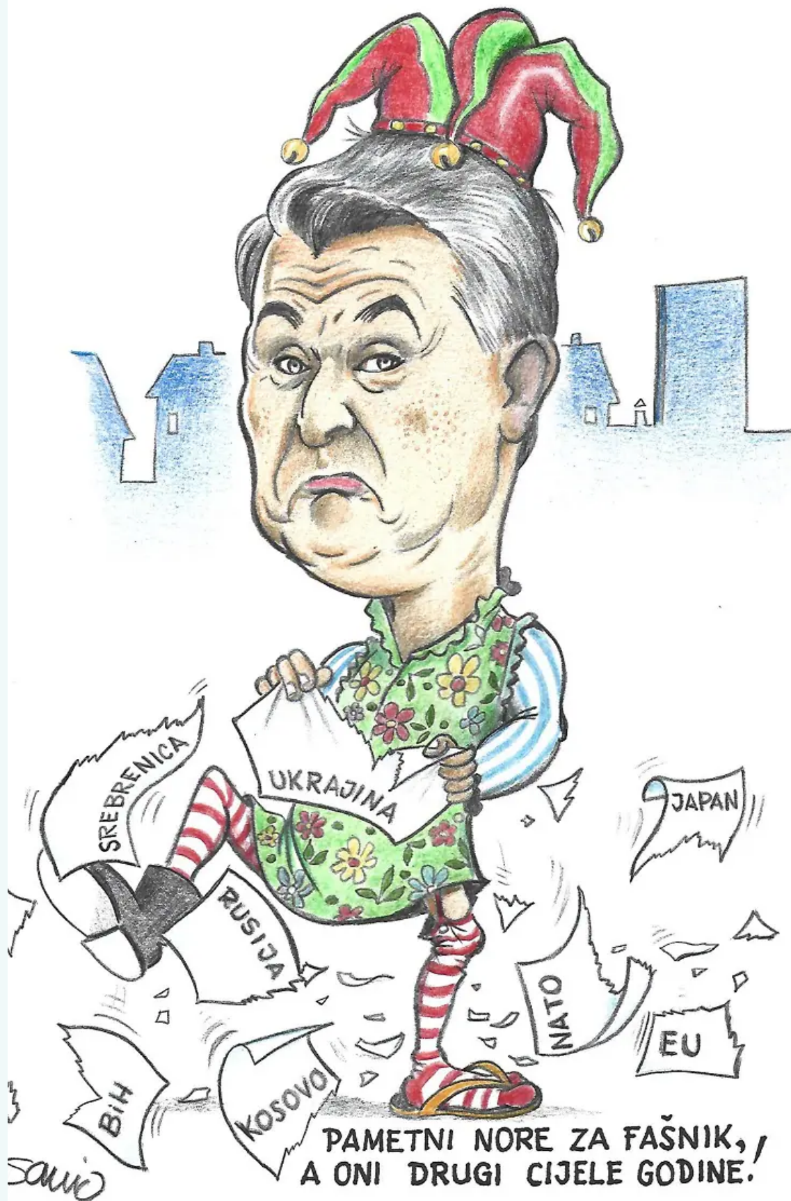
Autor: Mladen Savić

Početak 2022. godine novinarka Večernjeg lista Radmila Kovačević objavila je jedan poduži tekst o humoru u vrijeme pandemije kada nam je itekako