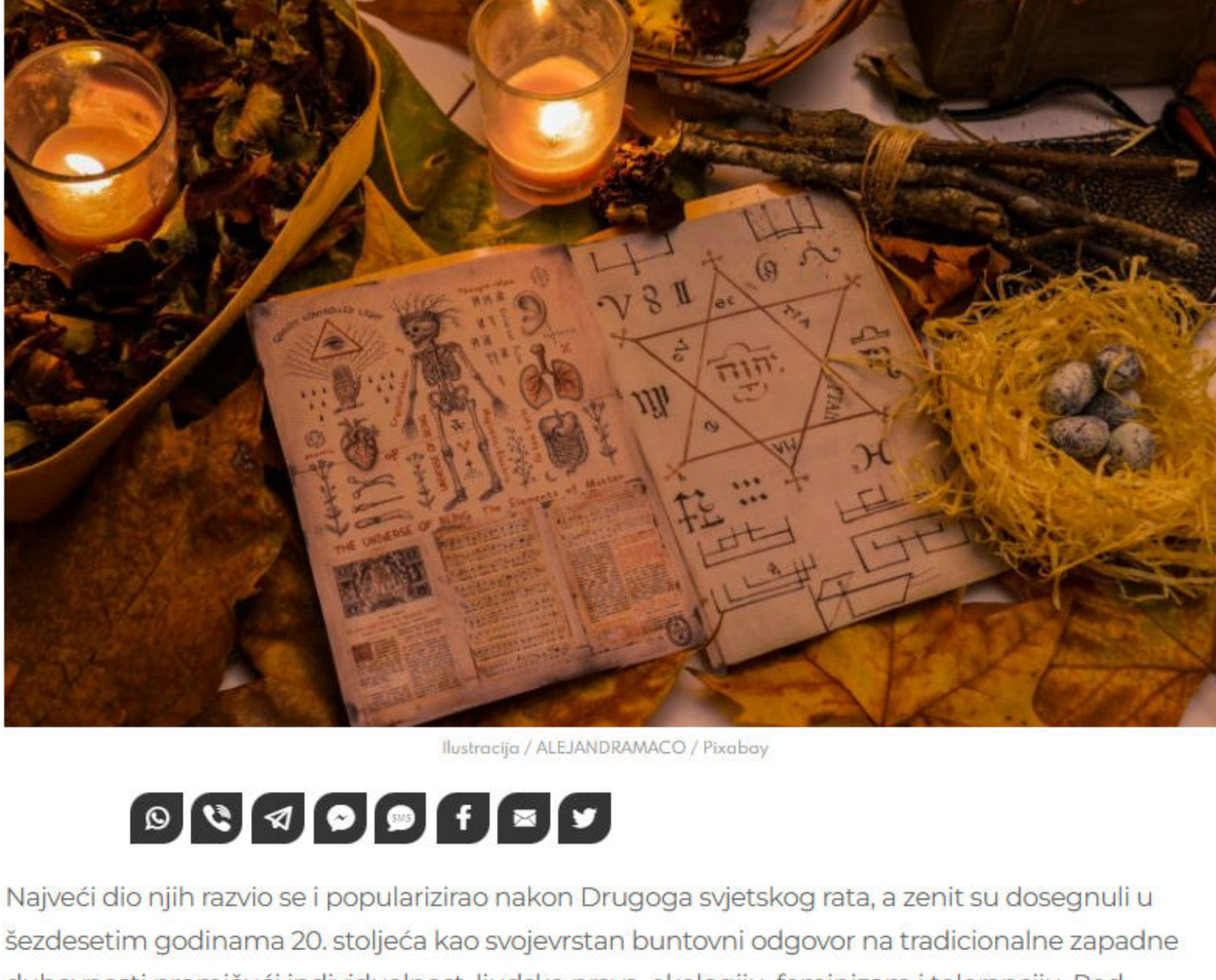
Ilustracija / ALEJANDRAMACO / Pixabay

PIŠE: DR. SC. DENIVER VUKELIĆ 11/10/2023, 16:59