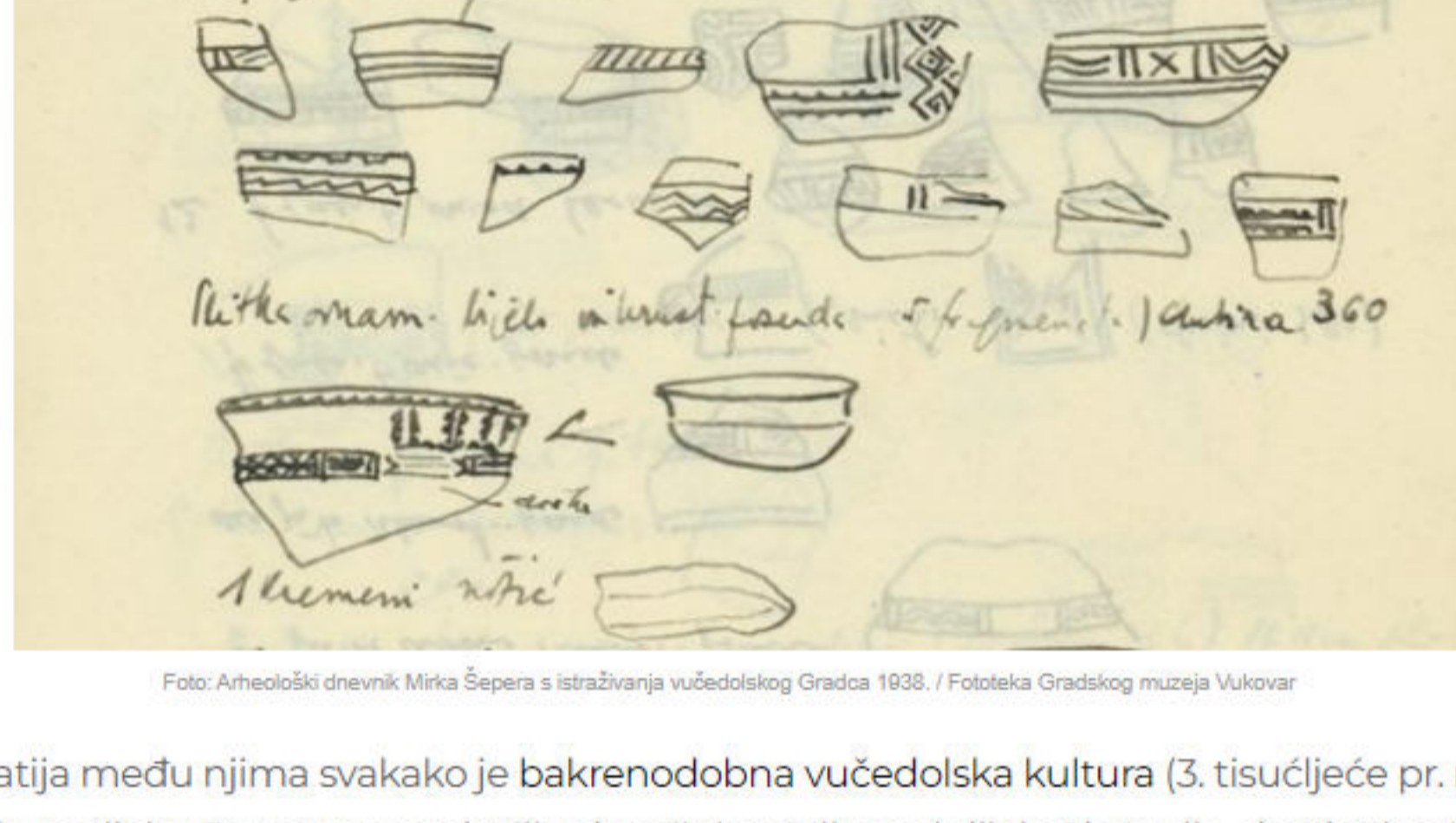
Foto: Arheološki dnevnik Mirka Šepera s istraživanja vučedolskog Gradca 1938. / Fototeka Gradskog muzeja Vukovar

Najpoznatija među njima svakako je bakrenodobna vučedolska kultura (3. tisućljeće pr. n. e.) koja se nalazila uz rijeku Dunav, na području današnjeg Srijema i dijela Slavonije, do planina Krndije i Dilja na zapadu. Danas se zna da su Vučedolci imali rodovsku organizaciju koju su predvodili knezovi, koji su uz sebe imali ratnički društveni sloj nastao od prvotnih lovaca. Svoja su naselja uglavnom smještali na povišenim terasama uz rijeke ili na obroncima brda, a bila su utvrđena drvenim palisadama ili vodenim opkopima. Kuće su bile opremljene ognjištem i malim kućnim žrtvenicima te jamama, koje su služile za spremanje zaliha. Jedno od najvažnijih obilježja vučedolske kulture je izrazito bogata proizvodnja keramike. Gospodarstvo se sastojalo od poljodjelstva i stočarstva te osobito razvijenog metalurgije bakra za koju se vjeruje da je imala i svoje ritualne magijske dijelove. Posuda koja je pronađena u Vinkovcima 1978. godine nazvana je Vučedolski Orion i smatra se da sadržava jedan od najstarijih indoeuropskih kalendara. Datirana je u vučedolsku kulturu, oko 2600. g. pr. n. e. Taj je kalendar nastao istodobno sa sumerskim i egipatskim kalendarima, a 260. g. razliku od njih, prikazuje zvijezda sjeverne 45. paralele i sva četiri godišnja doba. U vučedolskoj kulturi mogu se nazrijeti i religijsko-magijski tragovi šamanizma.