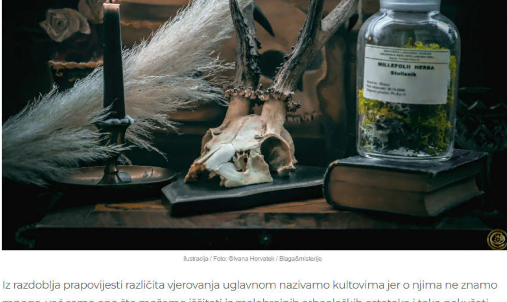
Ilustracija / Foto: @Ivana Horvatek / Blaga&Misterije

U počecima svoje kulture čovjek je vjerovao da je priroda oko njega živa i da on, kao njezin dio koji je izravno o njoj ovisan, može na nju utjecati određenim postupcima. Takav oblik vjerovanja nazivamo animizam. Čovjek je stoga stvorio niz različitih postupaka da bi prirodu učinio "sklonijom" njegovu preživljavanju. Ti su postupci trebali osigurati iscjeljivanja, komunikaciju s duhovima predaka, plodnost i rodost uroda i stoke, zaštitu od bolesti, ozljeda, loših namjera i mnoge druge. Uz te postupke stvoren je i niz postupaka namijenjenih štovanju božanstava. Od njih se tražila prisutnost i za određenih postupaka utilitarne naravi koji su trebali pomoći čovjeku u njegovu svakodnevnome životu. Iz prapovijesnog doba sačuvani su mnogobrojni idoli, obredne posude, amuleti, ukrasi i drugi predmeti za koje se smatra da su imali religijsko-magijsku svrhu.