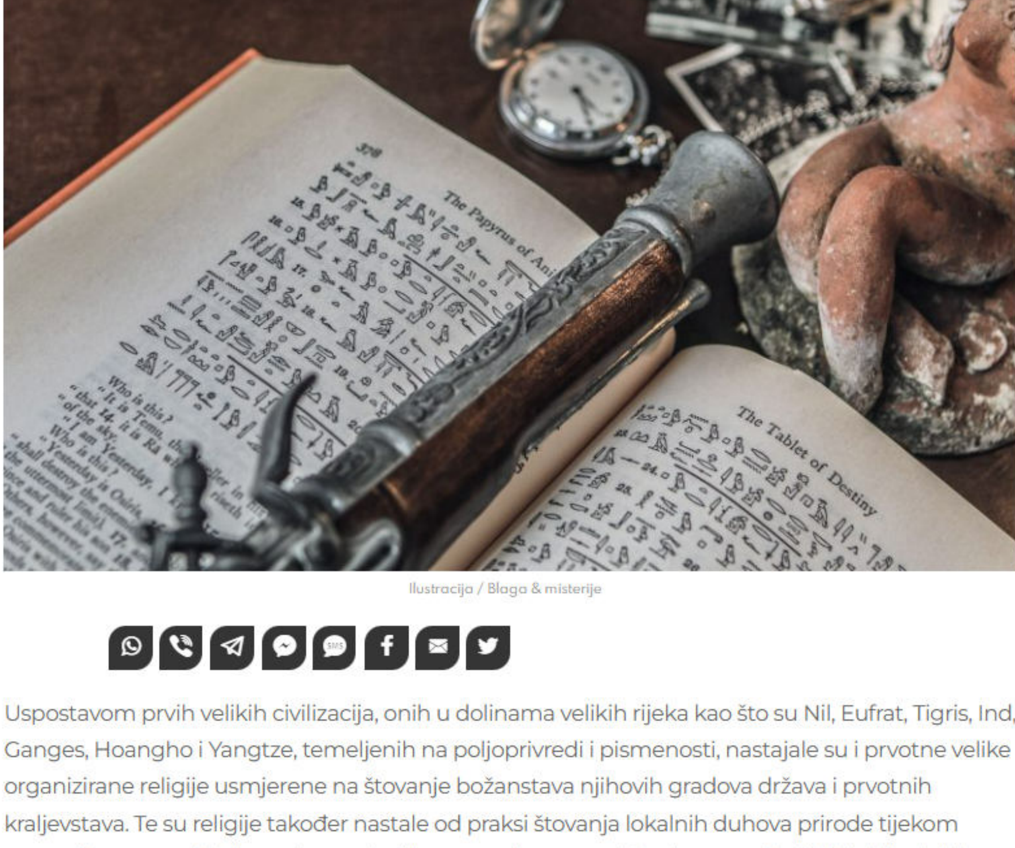
Ilustracija / Bloga & misterije

AUTOR: DR. SC. DENIVER VUKELIĆ 23/08/2023, 20:49