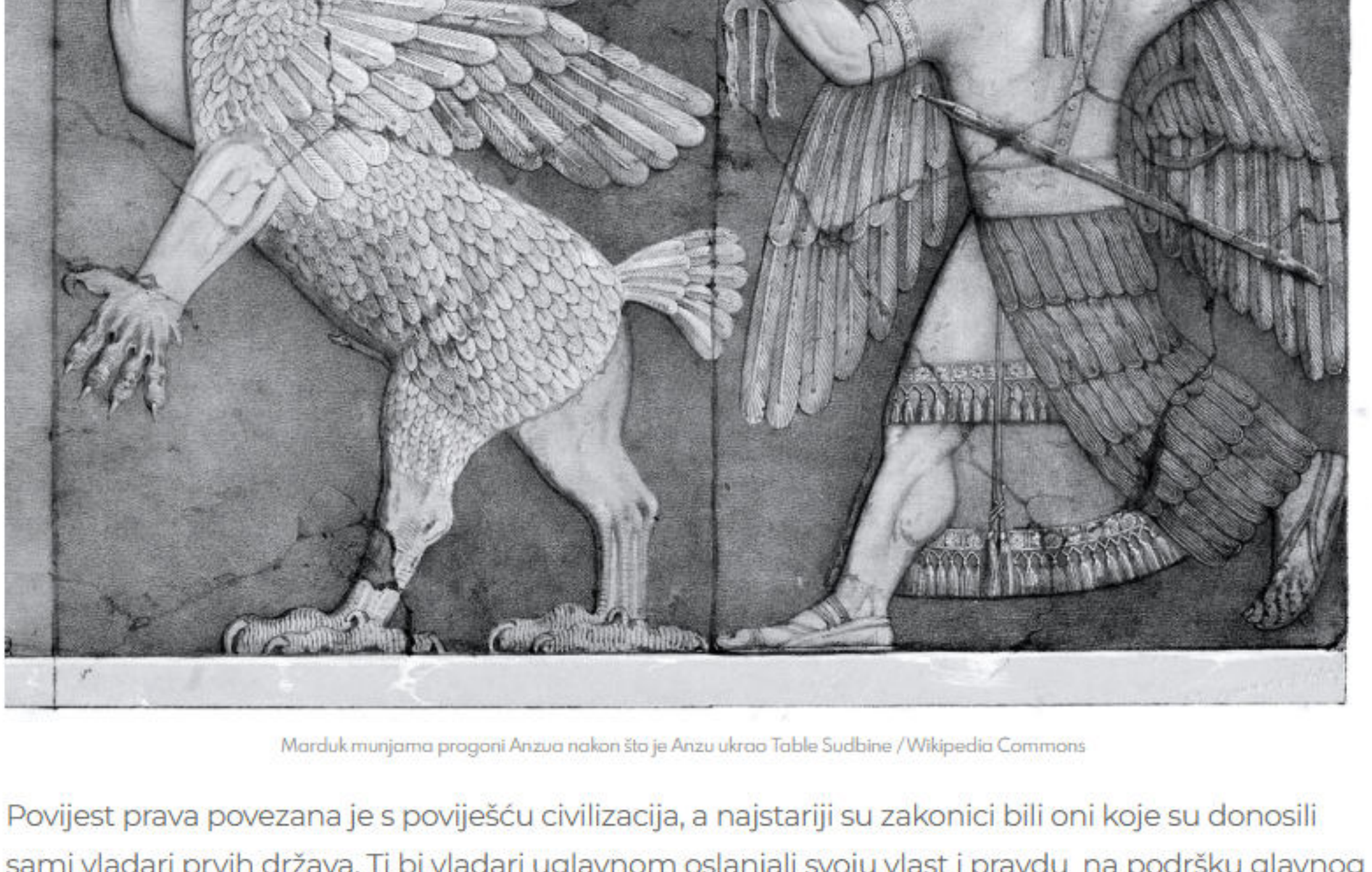
Mariduk murjama progoni Anzu nakon što je Anzu ukrado Table Sudbine

Također, kao odvojene promatra se tekstove vezane za divinaciju (proricanje), bilo astrološku, bilo astronomsku, bilo onu po utrobi životinja. Svi su ovi tekstovi u navedenim kulturama bili dio visoke, učene elite, dvora i klera te iz njih nije vidljiva svakodnevna pučka magija iako je moguće da su slične prakse, u jednostavnijem obliku, postojale i među pukom. U većini tih tekstova ritualom se komunicira s božanstvom zaštitnikom koje osobi treba dati moć za borbu i zaštitu od demona, bolesti, uroka i drugih nepovoljnih utjecaja. Vrlo su često to bila božanstva koja su bila smatrana patronima gradova država, a koja su među svojim božanskim atribucijama posjedovali i magiju. Primjer takvog božanstva sumerski je bog Enki (u akadskoj inačici Ea), patron grada Eridua, ili pak bog Marduk, zaštitnik grada Babilona.