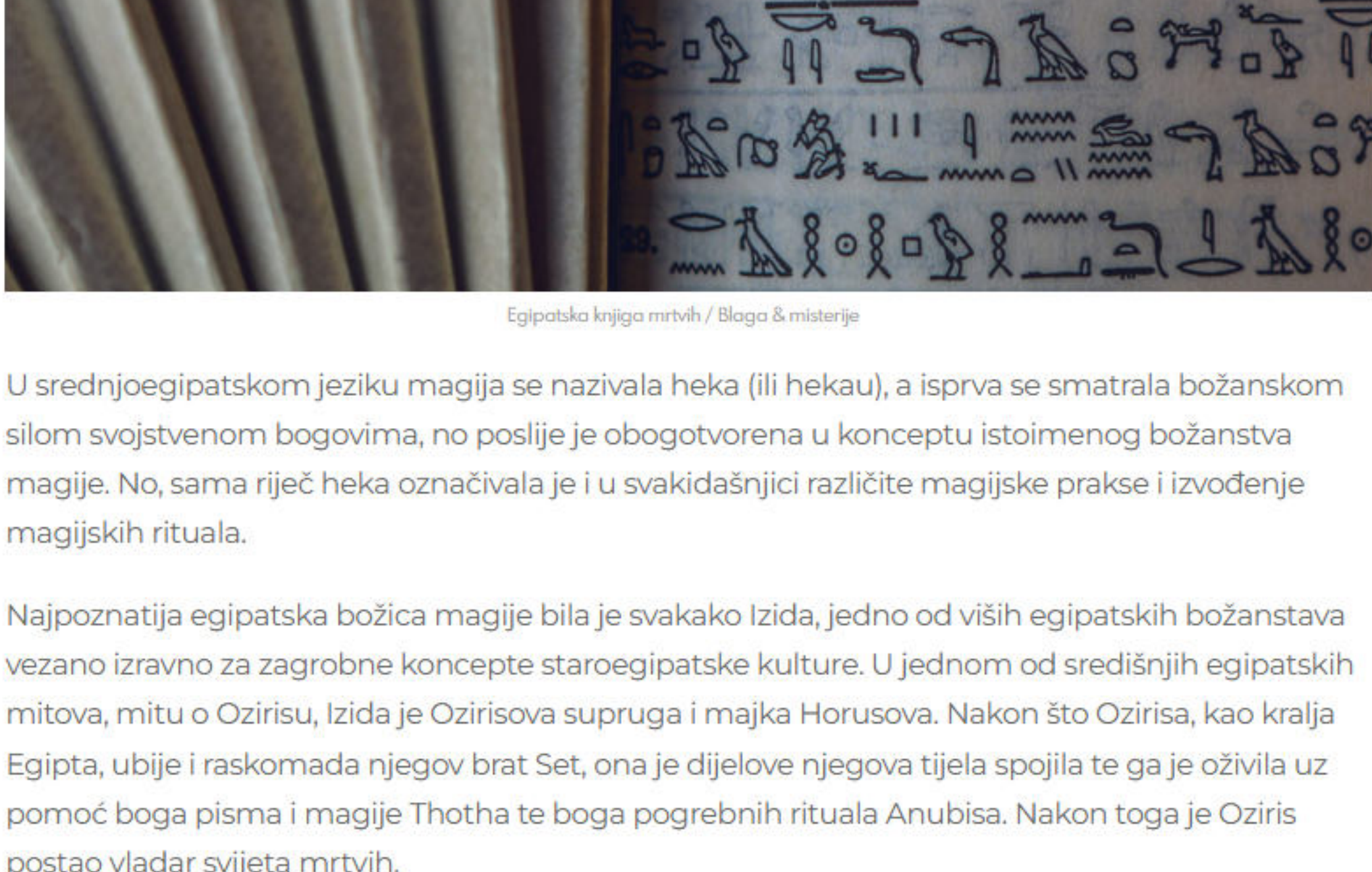
Egipatska knjiga mrtvih / Bloga & misterije

U tim je staroegipatskim religijskim kultovima magija također bila duboko isprepletana s religijom, a magijske prakse bile su, jednako kao i u Mezopotamiji, dio svih područja i razdoblja ljudskog života, od one svakodnevne (izrade različitih amuleta i talismana kako za žive tako za mrtve) pa sve do najsloženijih pogrebnih magijskih rituala čija je svrha bila osigurati uspješno putovanje čovjeka u onostrano. U početku su takvi složeni religijsko-magijski pogrebni rituali bili rezervirani samo za vladare i njihove obitelji, poslije i za dvorjane i upravitelje, a u posljednjim stadijima stare egipatske kulture u svojim skromnijim oblicima postali su dostupnima i nižim članovima društva.