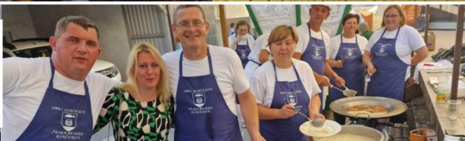
ČEŠKA BESEDA KONČANICA