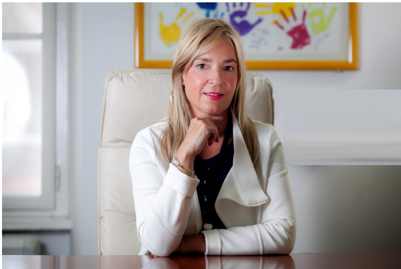
Pravobraniteljica za djecu Helena Pirnat Dragičević

Na porast vršnjačkog nasilja upozorila je i Pravobraniteljica za djecu navodeći kako je u 2022. godini njezin ured zaprimio dvostruko više pritužbi za vršnjačko nasilje u školama i vrtićima nego u 2021. godini.