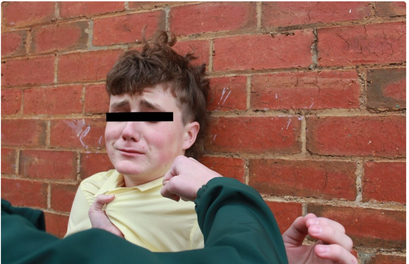
Fotografija je ilustrativnog karaktera

Postaje li vršnjačko nasilje sve okrutnije: Zlostavljanja je najviše među učenicima 4. i 8. razreda osnovne škole, a 71% učitelja ne reagira Ured Pravobraniteljice za djecu u 2022. godini zaprimio je dvostruko više prijava za vršnjačko nasilje u školama i vrtićima nego godinu dana ranije /// Iako se mnoge škole hvale da promiču nultu toleranciju prema nasilju, stvarnost je drugačija ///