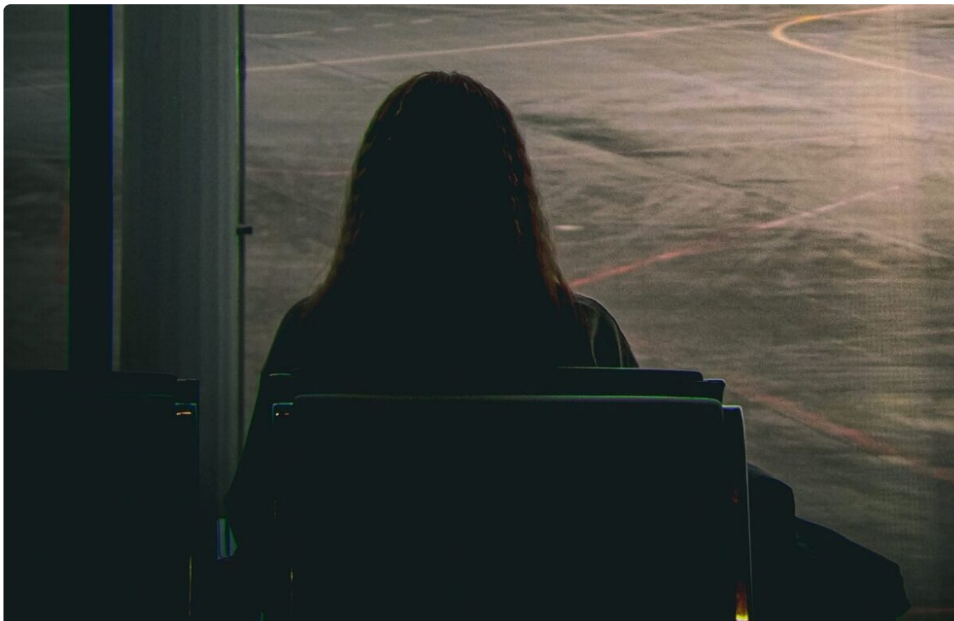
Ilustrativna fotografija