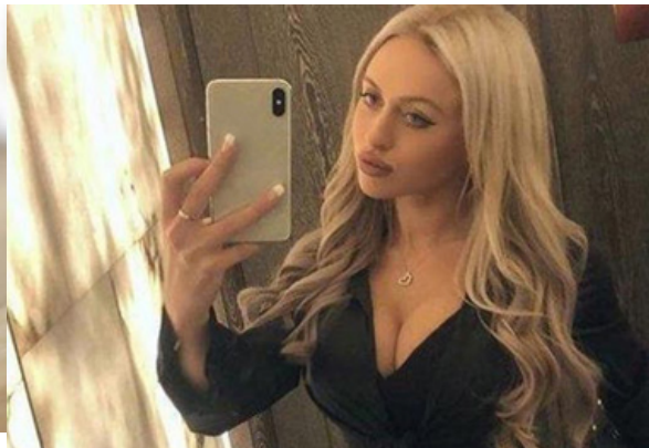
Dvije 19-godišnjakinje zarađuju bogatstvo s 1 ritualom