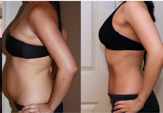
Riješite se bokova i celulita ovom novom metodom