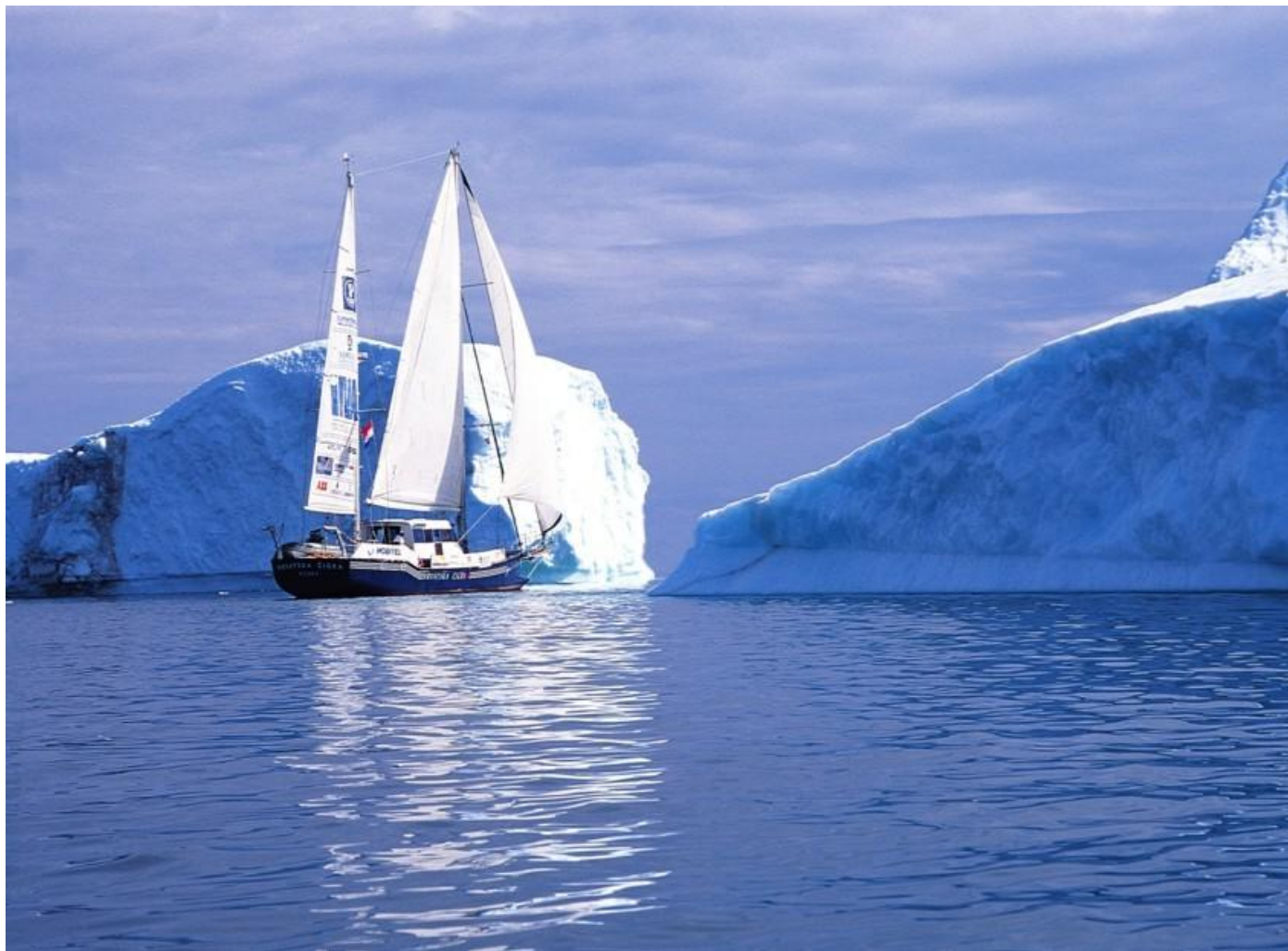
Hrvatska čigra na dalekom moru

nije šalio. Niti loša kava ih nije obeshrabrila. Tko je tada uopće mogao sanjati da se iza mirne vanjštine dipl.ing. Waltera krije osoba koja je doslovno spasila i sačuvala od JNA topovnjaču kasnije nazvanu PETAR KREŠIMIR IV, a da je Jura Crnković višestruki državni prvak u jedrenju i znalac nad znalcima kada su u pitanju podvodne linije jedrilice. – ispričao je kasnije Šutej .