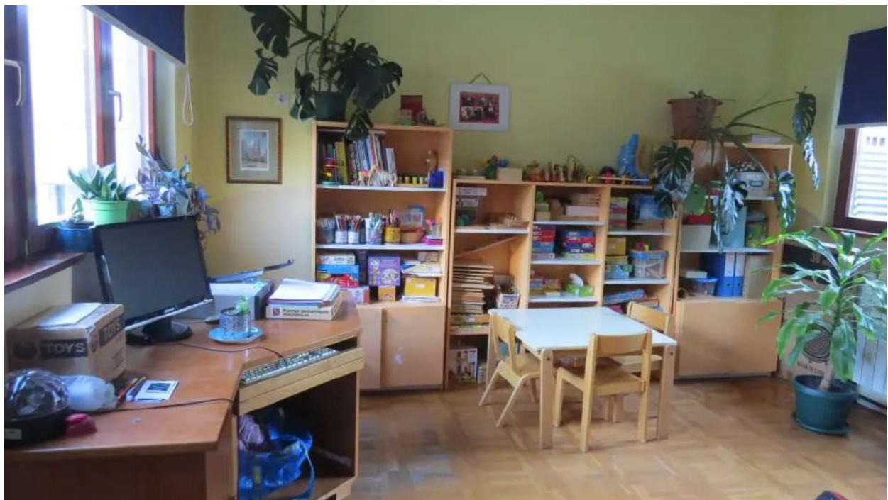
Kabinet edukacijskog rehabilitatora i logopeda u DV Potočnica

Djeci tipičnog razvoja inkluzija djece s teškoćama u njihovu vrtićku skupinu omogućuje upoznavanje, prilagođavanje i prihvaćanje vršnjaka koji su po nekim potrebama, mogućnostima i ograničenjima drugačija od njih. Inkluzija ih uči toleranciji, empatiji i prihvaćanju različitosti.