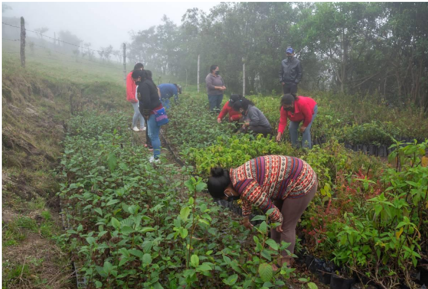
Sadnja stabala na Andama

On ističe kako je jako važno da u sadnji stabala sudjeluju lokalne zajednice, a ne da to radi netko sa strane , zato jer je to ponajprije zadatak zajednice, a onda i zato što će na taj način postati bliski s tim procesom, te će u budućnosti nastaviti s njim, s generacije na generaciju. Kako kaže, u naravi, to nije ništa drugo nego oživljavanje praksi drevnih naroda. A ti su drveni narodi, očito je, bili jednostavno mudri jer su shvaćali jednostavnu činjenicu kako ne mogu preživjeti uništavajući svoje okruženje radi kratkoročne koristi, te da usput moraju pomoći prirodi da se obnavlja sadnjom adekvatne vegetacije itd.