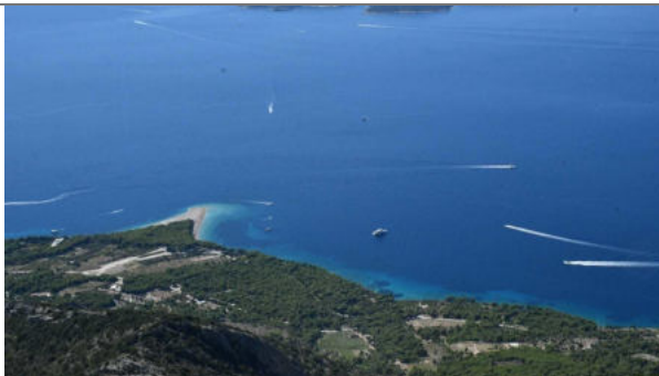
Pogled s Vidove gore gdje je sniman 'Faraway'