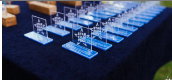
ZAVRŠIO JUBILARNI 10. STAR FILM FEST Nagrađeni najbolji kratki filmovi, održana i izložba o festivalu