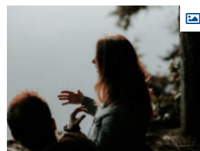
KOMUNIKACIJSKI HORIZONTI Interaktivna konferencija koja