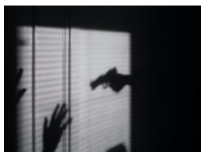
MUČNI SLUČAJEVI Od 2024. femicid ulazi u kazneni zakon, ali