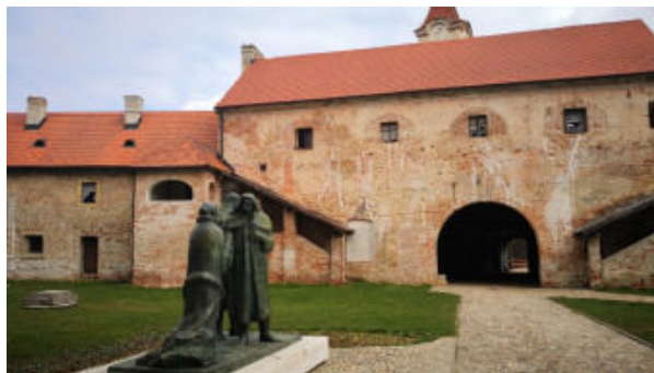
ZELENA DESTINACIJA Međimurje prva regija u Hrvatskoj i četvrta na svijetu s prestižnom nagradom