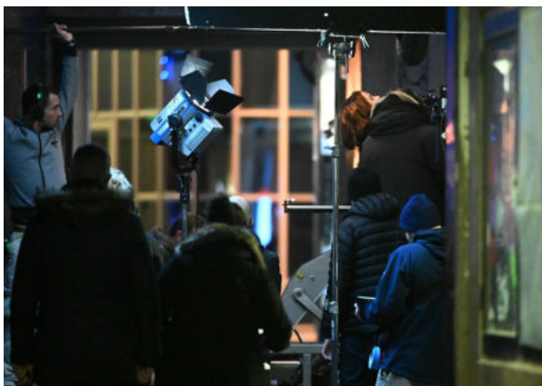
Glumica Kate Beckinsale na snimanju akcijskog trilera Canary Black u centru Zagreba. Kate Beckinsale u filmu utjelovljuje agenticu CIA-e Avery Graves.

Zagreb je ove godine bio nominiran za najpoželjniju novootkrivenu i brzorastuću lokaciju za snimanja, radi snimanja filma Canary Black. Hrvatska ima jedan od najdugovječnijih festivala nacionalnog filma na svijetu – Pula Film Festival – s okruglih 70 godina tradicije. Čak 109 projekata snimljeno je u Hrvatskoj u razdoblju od 2012. pa do 2022. Ove godine dodat će se na popis još 15-ak novih. Ovdje su stvarala glumačka imena poput Anthonyja Hopkinsa, Richarda Gere, Nicolasa Cagea i Salme Hayek.