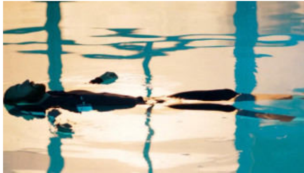
NAJHRABRIJI FILM BALKANA 'Pelikan' stiže na ljetnu pozornicu Tuškanac