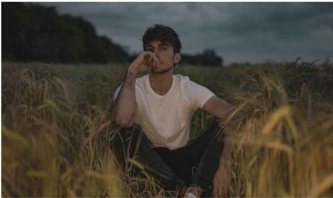
Ozren K. Glaser / privatna arhiva