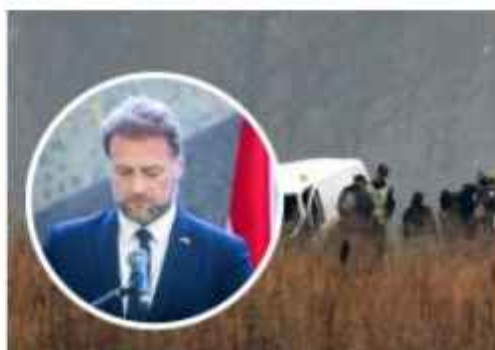
Vještačenje kod dužnosnika