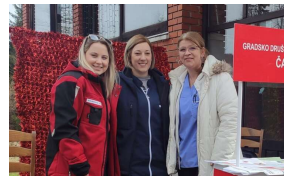
'Pravo na pomoć u kući je spas za starije Gorane, ne moraju u starački dom'