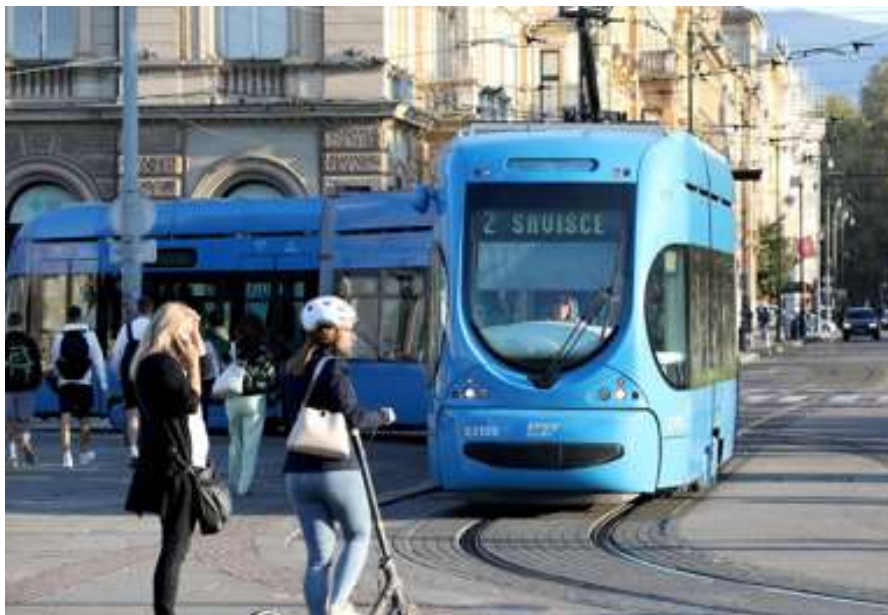
VELIKA NOVOST U ZET-OVIM TRAMVAJIMA: 'Kad sam čula što su uveli, mislila sam da je šala. Ali ne...'