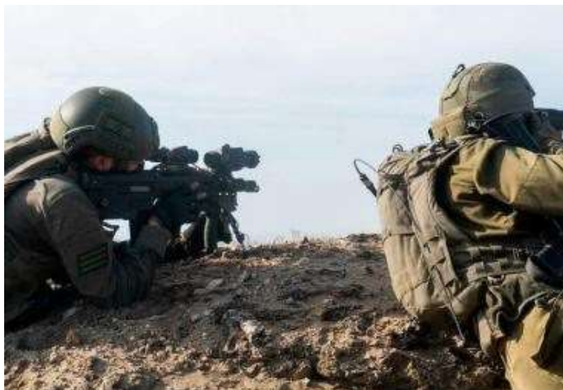
Hamas uputio oštru poruku: 'Ubit ćemo sve preostale taoce ako se ne ispune ovi zahtjevi'