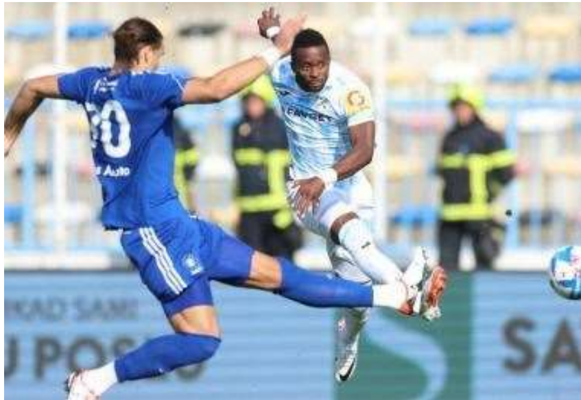
Rudeš vs Rijeka je mali hrvatski kup-klasik koji je znao ponuditi i šokantne nogometne trilere