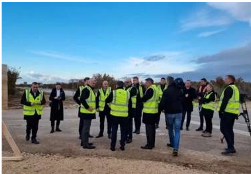
Počela rekonstrukcija raskrižja na ulazu u Škabrnju koja će povećati prometnu sigurnost