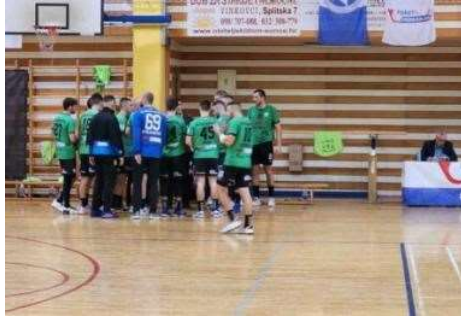
Bezbolan domaći poraz Vinkovčana