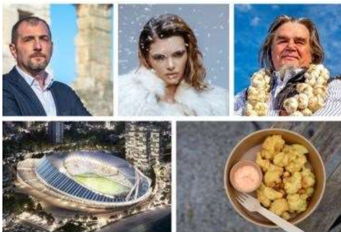
Pet crtica na kraju tjedna: Probali smo istarske fritule s tartufima. Odlične su!