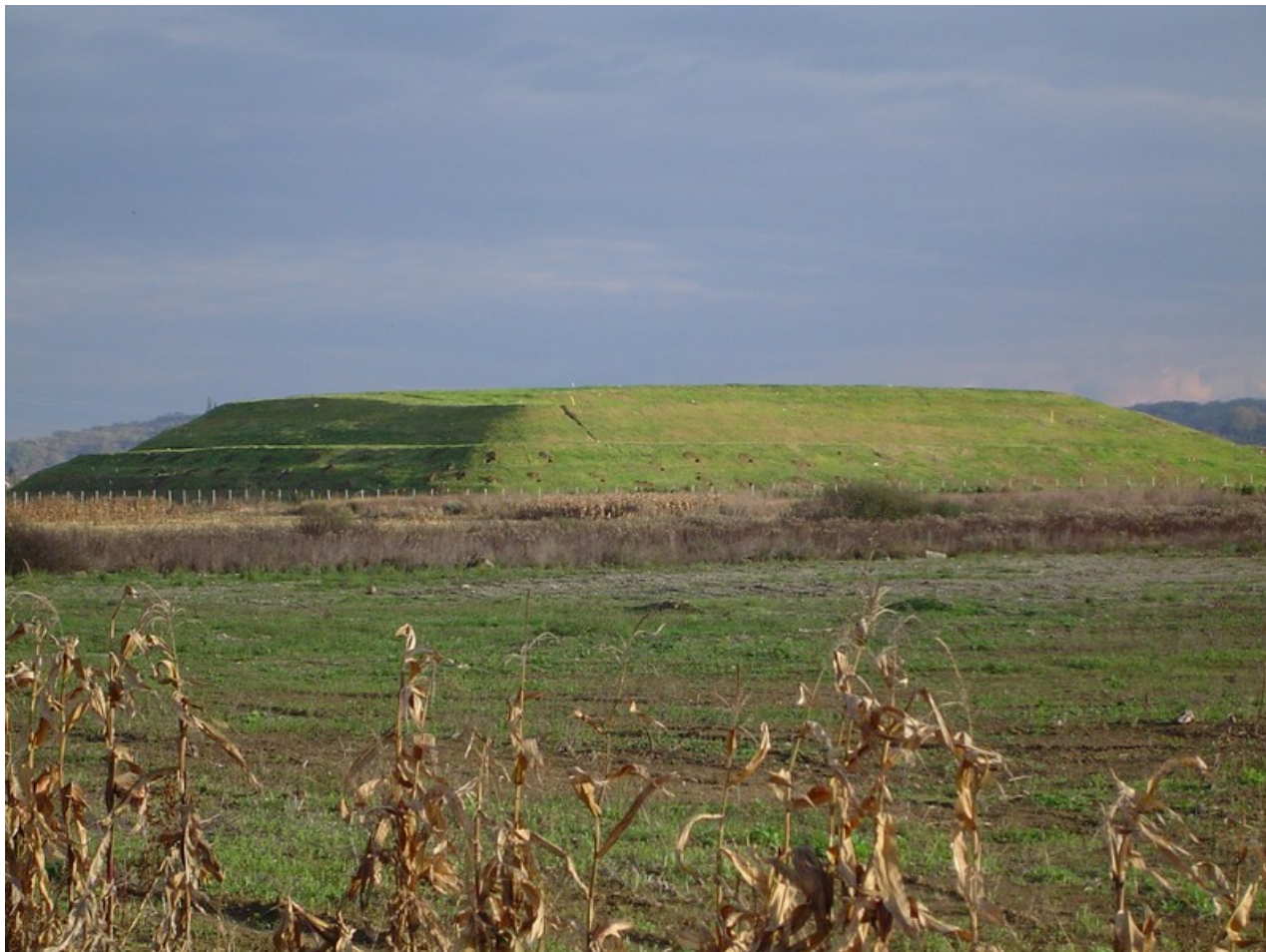
Ovako je odlagalište u Turčinu izgledalo nakon sanacije jedne od kazeta, prije sadnje zelenila

Varaždinska županija, kao jedinica regionalne samouprave, nema zapravo nikakve ovlasti nad odlagalištima. Općine i gradovi, jednako kao i danas, imaju obvezu same osigurati kako će se i gdje zbrinuti komunalni otpad, dok središnja država daje tek strateške smjernice i definira obveze. Sabati je stoga zaigrao na koordinacijsku ulogu, no vrlo brzo dobit će jednu još značajniju zadaću.