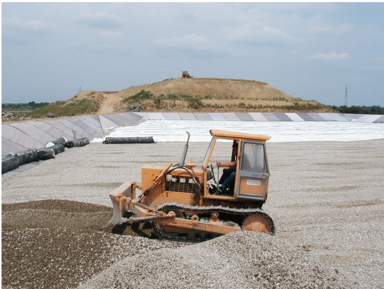
Gradnja kazete na odlagalištu

Odlagalište otpada u Turčinu – mjestu u sklopu Općine Gornji Kneginec koje neposredno graniči s Gradom Varaždinom – može se pohvaliti da je prvo odlagalište u Republici Hrvatskoj koje je zatvoreno i sanirano prema svim zakonom određenim procedurama. Dugačak su put prošli žitelji Kneginca dok se napokon nisu oslobodili tuđeg otpada u svojem dvorištu, odloženog tek par stotina metara od najbližih kuća, a ta je borba započela prije punih 30 godina.