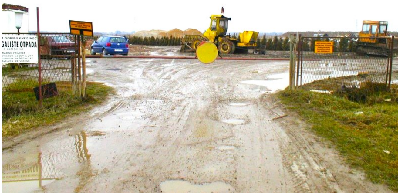
Stara ulazna rampa na odlagalištu otpada u Turčinu