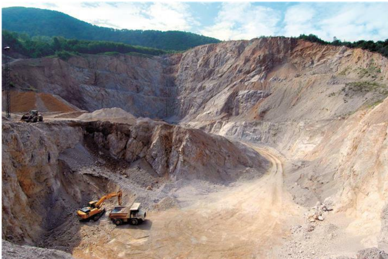
Sabatijeva ideja o regionalnom odlagalištu u Očuri nije prošla

No nije prošlo. U novinama toga vremena piše da je na sastanku u Očuri u lipnju te godine, na kojem su se s mještanima sastali predstavnici Varaždinske županije, Grada Lepoglave i privatnog investitora – došlo gotovo do fizičkog obračuna.