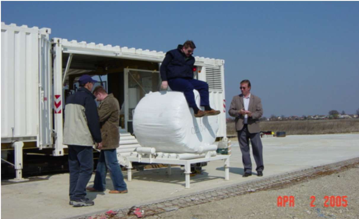
Prva bala komunalnog otpada zamotana je 2. travnja 2005.

Komunalni otpad prije baliranja prošao je svojevrsnu obradu. Naime, kako navodi Plan gospodarenja otpadom Grada Varaždina iz toga vremena, Varkomovi djelatnici iz otpada su vadili staklo i krupniji metal te papir i plastiku. Potom su se magnetom vadili sitniji metali, da bi se nakon toga otpad drobio i balirao. Koliko je taj postupak bio efikasan, drugo je pitanje.