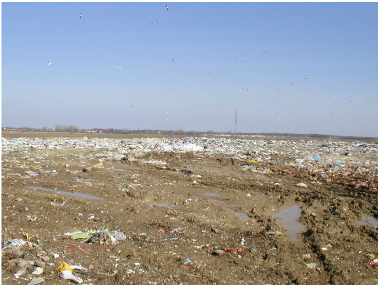
Mještanima koji su živjeli pored odlagališta nije isplaćivana nikakva ekološka renta