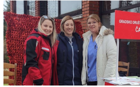
'Pravo na pomoć u kući je spas za starije Gorane, ne moraju u starački dom'