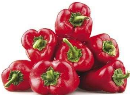
Top 10 jela s paprikama