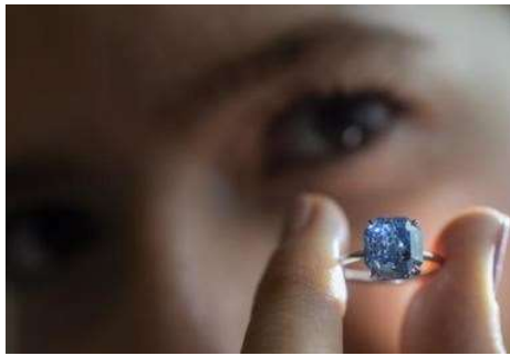
Prsten je završio u usisavaču