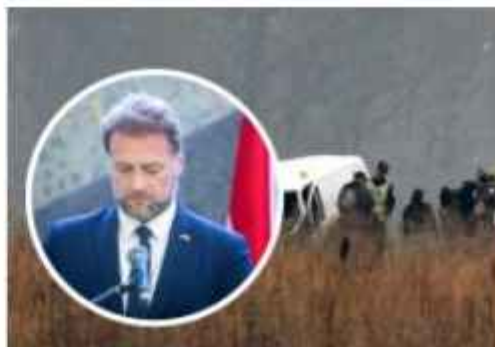
Vještačenje kod dužnosnika