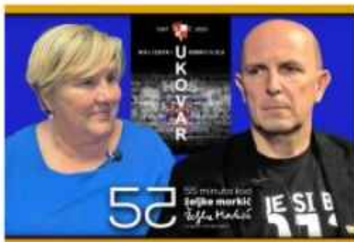
Pljuju po Hrvatskoj državi