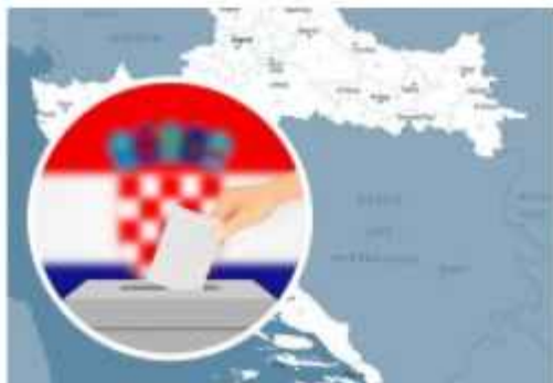
MOST-a i DP-a zajedno za izbore