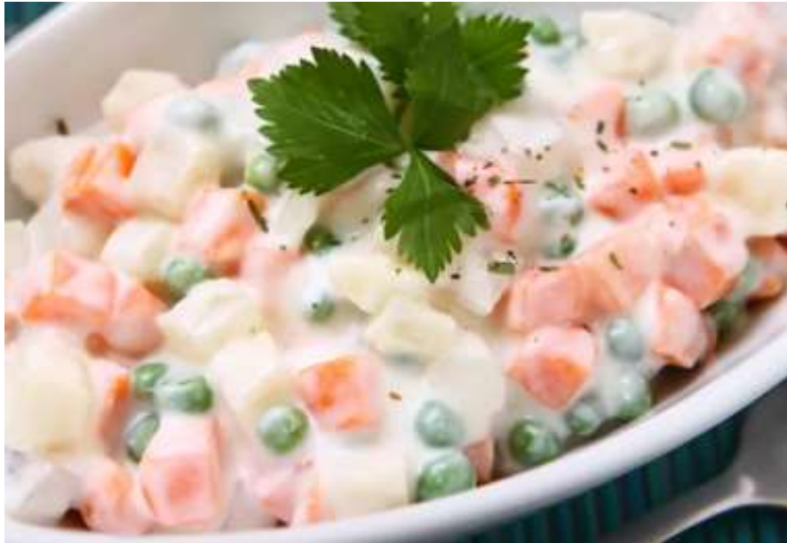
NI FRANCUSKA, NI PEČENJE, NI KOLAČI: Znaete koje je hit blagdansko jelo u Hrvatskoj ove godine? Iznenadit će vas