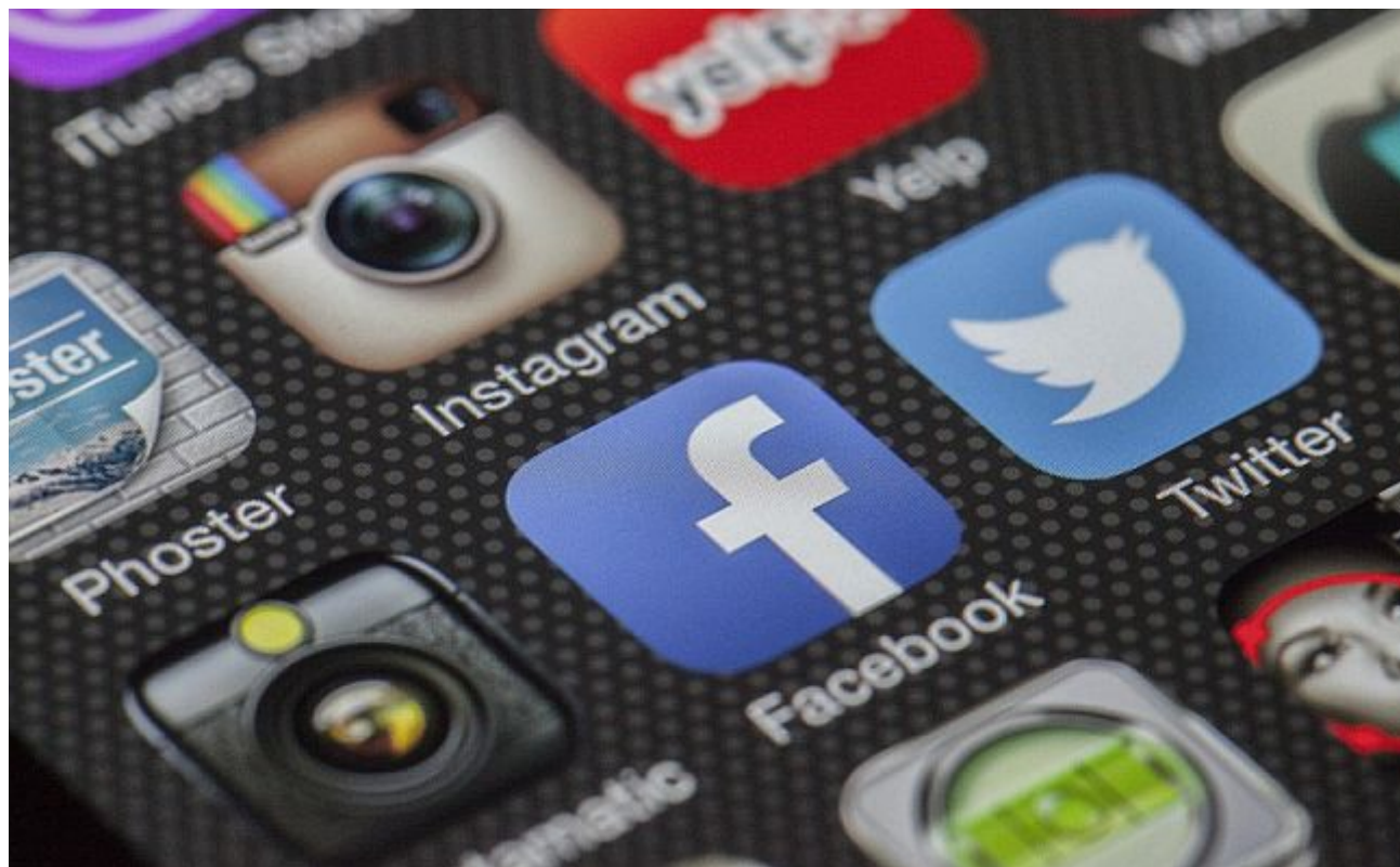
Dugo su gotovo bez nadzora bile objave na društvenim mrežama

Pa se najmanje već jedno desetljeće govori kako živimo u društvu post-istine . Nije da istina ljudima više nije važna nego ju je teže razabrati, stručnost se zanemaruje, izigrava i napada, a šarlatanstvo cvijeta. Nije tako skroz generalno, ali je višegodišnji trend i naravno nije samo kod nas u Hrvatskoj nego manje-više svugdje. Post-istinite informacije nisu samo lažne vijesti, nego i sustav polu-istinitih tvrdnji koje se onda prenose i u virtualnom prostoru, ali i u mainstream medijima. To se nadograđuje i pogoduje različitim teorijama zavjere. Dobro, čitava ljudska povijest je povijest prijepora istina i laži. I javno se lagalo oduvijek i često je to bilo za lažljivce unosno. A svaki totalitaristički sustav je društvo laži („Totalitarizam konstruira stvarnost i sam stvara svoje istine“ - Hannah Arendt).