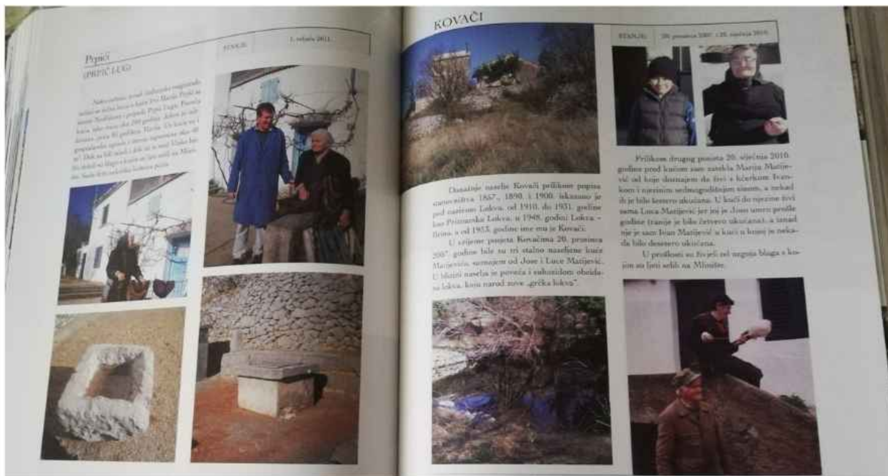
detalj iz knjige 'Sela i stanovi na Velebitu'

"Još uvijek je mnogo toga od nedostajalo, osobito geografske karte kontinenta, atlasi, globusi... pa sam iskoristila poznanstva. Nakon malo uvjeravanja direktor jedne riječke tvrtke, porijeklom Gospićanin, poslao nam je pun kombi karata i globusa koje smo mu rekli da trebamo. Onda je došla na red sportska oprema – bilo je lako djeci koju zanima nogomet kupiti lopte, ali neki su učenici željeli igrati šah, a nismo imali šahovske satove. Nije ih se u poratno doba moglo kupiti u Hrvatskoj, pa sam organizirala da se preko Mađarske četiri garniture dopreme iz tvornice Insa u Novom Sadu. Kasnije smo naše satove posuđivali gospićkom šahovskom klubu.