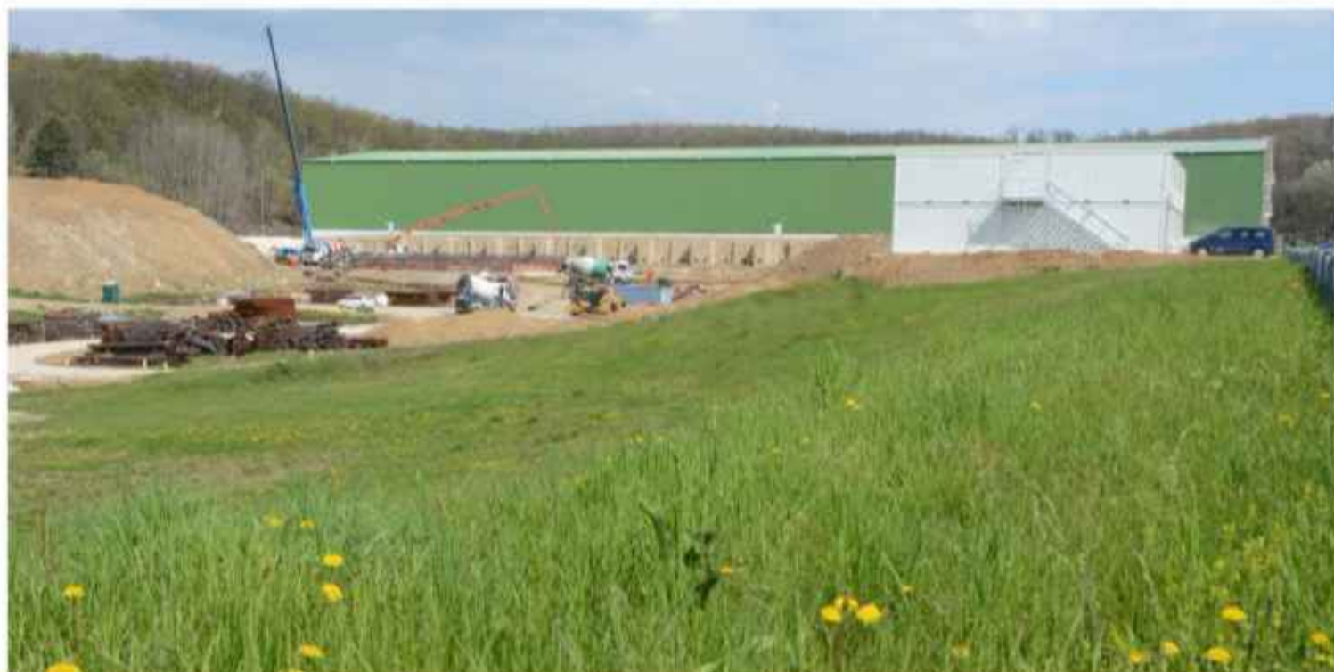
Gradilište nove hale odlagališta RAO-a u Slovačkoj

No, kako je ipak riječ o specifičnim objektima, slovački stručnjaci i lokalni stanovnici istaknuli su veliku važnost stalnog i što boljeg informiranja javnosti o odlagalištu. Kod takvih objekata je, napomenuli su, nužna suradnja sa lokalnim stanovništvom, nevladinim udrugama i okolnim državama. Slovačka s time nema problema, iako su NE Mochovce i odlagalište 60 km od mađarske granice.