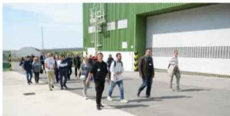
Predstavnici općine Dvor u obilasku odlagališta

Predstavnici lokalne zajednice Općine Dvor prvo su obišli grad Nitru, kraj kojeg se nalazi NE Mochovce, postrojenje za obradu i kondicioniranje tekućeg RAO-a i odlagalište niskoradioaktivnog, vrlo niskoradioaktivnog i institucionalnog radioaktivnog otpada. Nitra je poznata i po Nacionalnom prirodnom rezervatu Zoborská lesostep koji posjećuju brojni turisti.