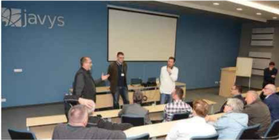
Predstavnici lokalne zajednice istaknuli su da odlagalište nije opasno

Prema riječima njegovog voditelja Ladislava Ehnä, cijelo odlagalište je pod stalnim detaljnim monitoringom pa se prate sve sastavnice okoliša, od zraka do podzemnih voda, tako da bi se bilo kakvo ispuštanje odmah otkrilo, a svi podaci o rezultatima monitoringa su javno dostupni. Također je istaknuo da je cijeli kompleks odlagališta projektiran i izgrađen tako da može neoštećen izdržati najjači mogući potres u Slovačkoj.