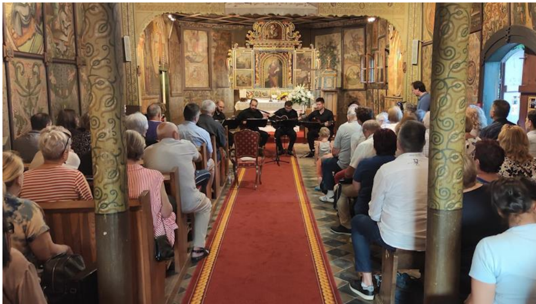
Koncert u Kapeli sv. Barbare

Prema legendi, Barbara je prije pogubljenja molila za spas svakoga kršćanina koji se sjeti Kristove muke i njezina mučeništva. Nebo je potvrdilo da će molitva mučenice Barbare biti uslišana. Stoga se u ikonografiji sv. Barbara prikazuje s kaležom i hostijom – simbolima sakramenta euharistije. Vjernici se sv. Barbari mole u pogibelji kada nisu u mogućnosti ispovjediti se i primiti bolesničko pomazanje. Sv. Barbara štuje se kao zaštitnica: geologa, zidara, tesara, arhitekata, zemljoradnika, električara, zvonara, kuhara, oružara, djevojaka, zatvorenika. Štuje se i kao zaštitnica od groznice.