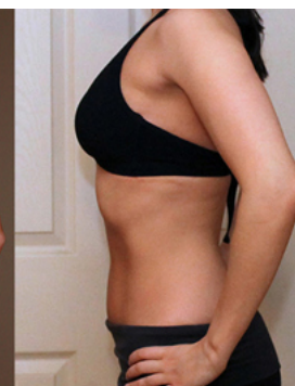
Riješite se bokova i celulita ovom novom metodom