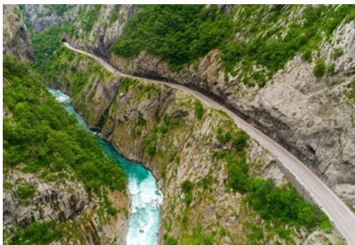
Kroz impresivni kanjon rijeke Morače