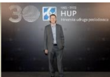
Izabrano novo vodstvo HUP-Udruge trgovine