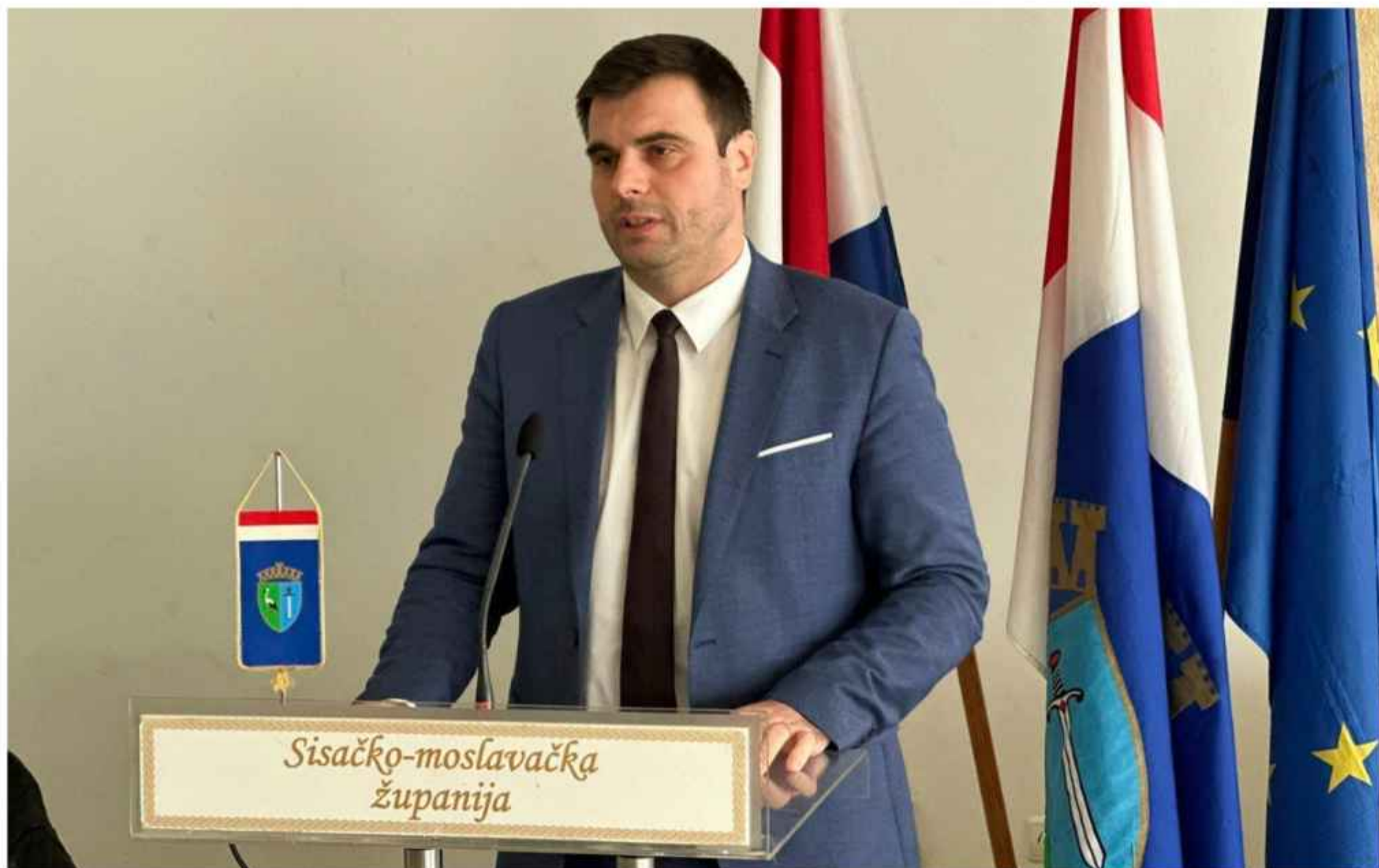
Župan sisačko-moslavački, Ivan Celjak

Na području Siska, zahvaljujući toj aktivnosti, saniran je i moderniziran neasfaltirani dio nerazvrstane ceste do naselja Veliko Svinjičko u ukupnoj duljini od 5.600 metara, u Općini Martinska Ves u naselju Tišina Erdedska u duljini 2.250 metara, a na području Petrinje će se do kraja 2023. godine sanirati i modernizirati neasfaltirani dio dvaju nerazvrstanih cesta u ukupnoj duljini 4450 metara za što je ukupno izdvojeno 1,8 milijuna eura.