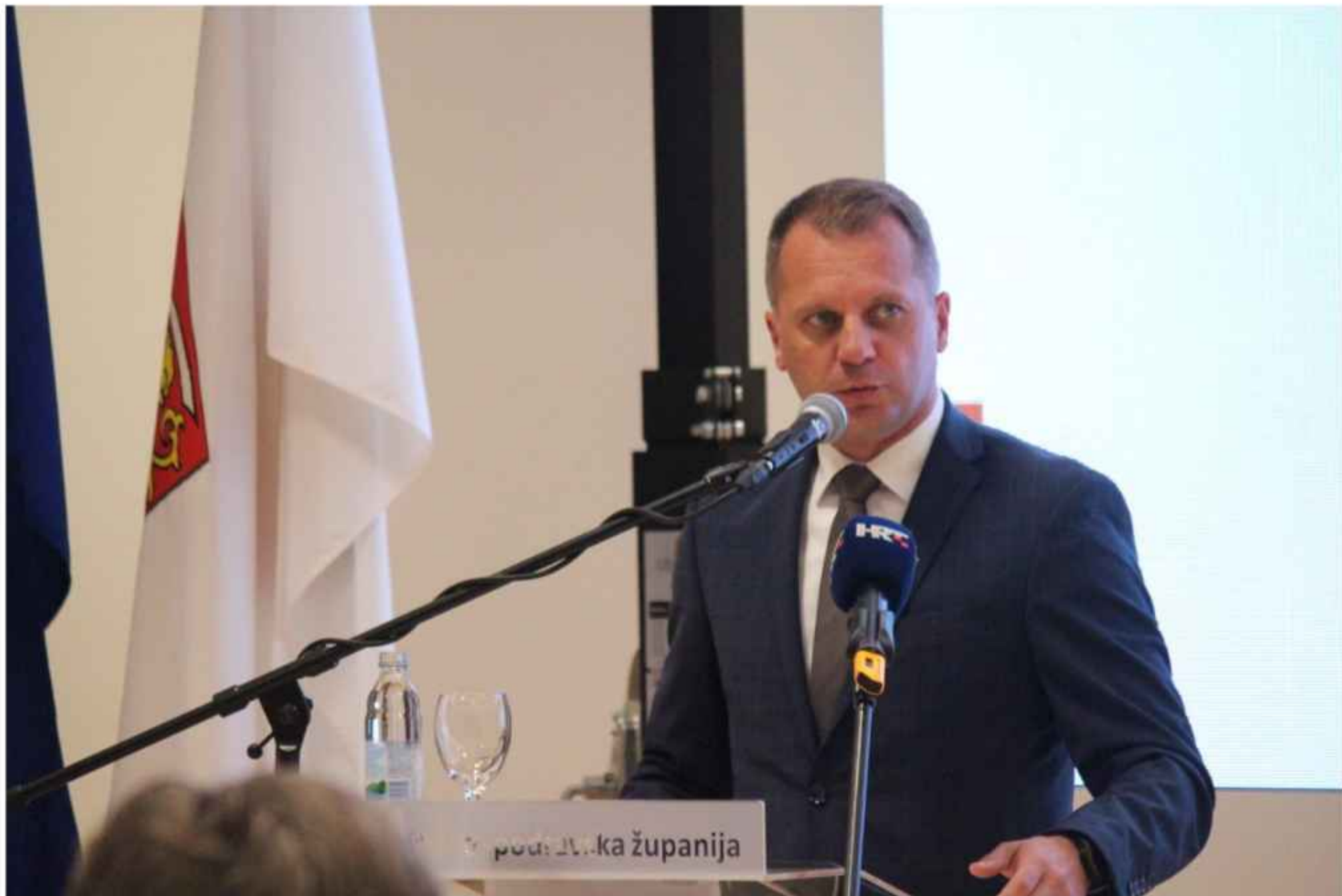
Virovitičko-podravski župan, Igor Andrović

"U trinaest općina i tri grada izgrađeno je 11 novih vrtića, kontinuirano ulažemo u zdravstvenu zaštitu stanovnika ruralnih područja kroz obnovu i opremanje ambulanti za pregled pacijenata u svim općinama, a osiguravamo i dovoljan broj liječničkog i medicinskog osoblja", kaže virovitičko-podravski župan Igor Andrović .