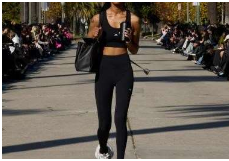
Balenciaga je predstavila novi model XL tenisica