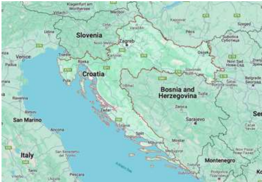
OVAJ BOŽIĆ BI MOGAO BITI DRUGAČIJI OD SVIH DOSAD: Evo što će nas dočekati za samo par dana...