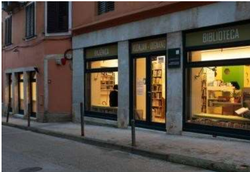
Otvorenje izložbi, radionica izrade ukrasnog veza, koncert studenata muzičke akademije...