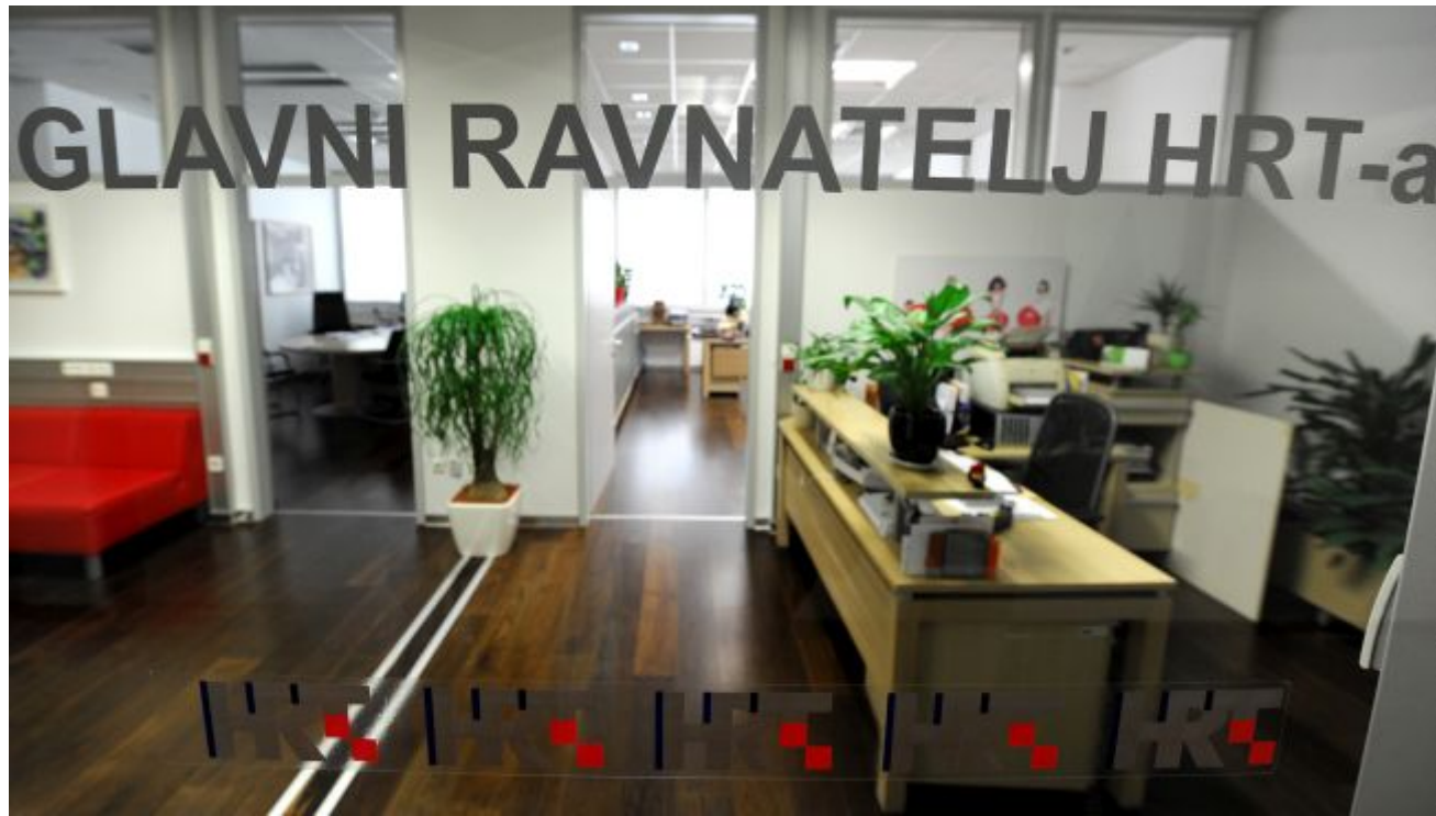
Danas natpolovična većina saborskih zastupnika bira Glavnog ravnatelja HRT-a

Od 2003. pa do 2012. godine šefa HRT-a biralo je Programsko vijeće HRT-a u kojem su sjedili javni djelatnici i kulturnjaci koje je birao Sabor, tako da ih je šestero predlagala vladajuća stranaka, a pet oporba. Programsko vijeće je Glavnog ravnatelja biralo dvotrećinskom većinom, znači da je bio potreban izvjesni konsenzus vladajućih i oporbe. No, 2012. godine vlada Zorana Milanovića donijela je zakon prema kojem natpolovična većina saborskih zastupnika bira Glavnog ravnatelja HRT-a. To je, naravno, politički pristraniji način izbora i poslije toga, HDZ-u više nije padalo na pamet da opet mijenja način izbora, da on ponovno bude demokratičniji.