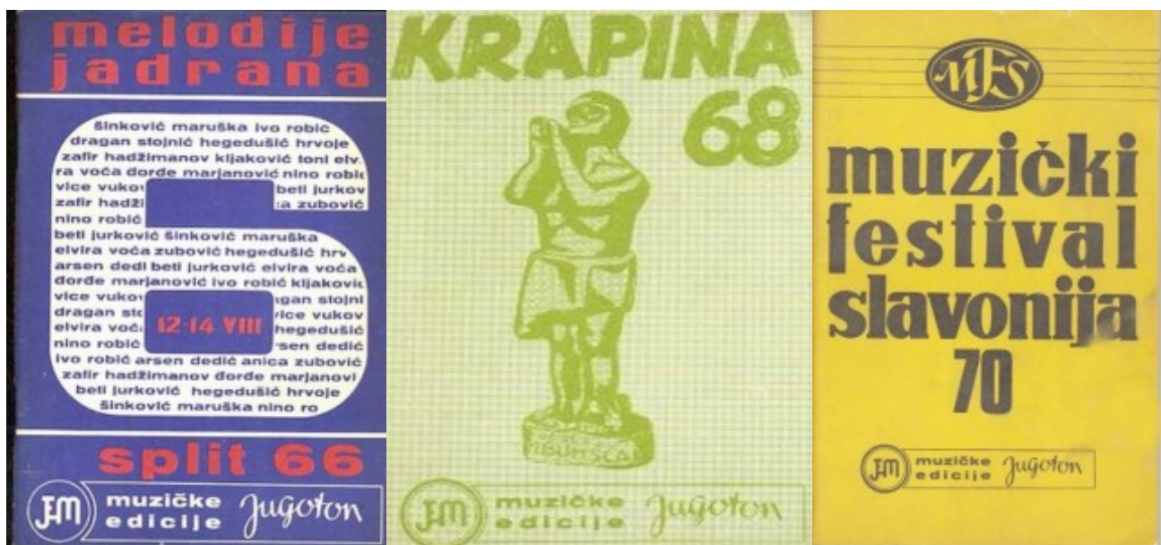
Melodije Jadrana Split '66 – Krapina '68 – Slavonija '70 (naslovnice)

Kreće se i s objavljivanjem nota s festivala zabavne, a i narodne glazbe, kojih je u to vrijeme bilo poprilično puno. Prema meni dostupnim podacima, prvo festivalsko notno izdanje bilo je Melodije Jadrana Split 1966. , zatim su uslijedila Melodije Jadrana Split 1967. i Melodije Jadrana Split 1968. Te, 1968. godine, Jugoton objavljuje i note s Festivala kajkavske popevke Krapina 1968. te festivala narodne glazbe Ilidža 68. Sljedeće, 1969. godine, objavljene su note s festivala Slavonija Požega 1969., Vaš šlager sezone Sarajevo i Krapina 69.