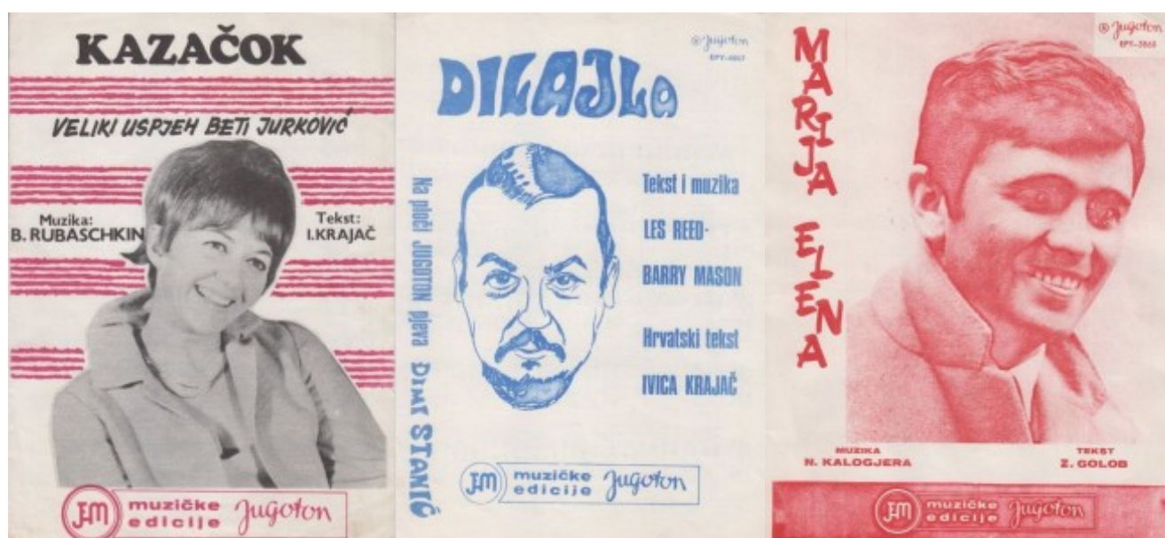
Kazačok – Dilajla – Marija Elena (naslovnice)

Deset godina kasnije, 1957. kreću u vlastitu proizvodnju malih singl ploča na 45 okretaja u minuti te EP-a s 33 okretaja. Ponovno, desetak godina kasnije pokreću JEM (Muzičke edicije Jugoton) koji počinje objavljivati i notne materijale, najprije u pojedinačnim arcima, a potom i kao zasebne notne knjižice. Prva notna izdanja bila su uglavnom prepjevi velikih inozemnih hitova (“Kazačok”, “Dilajla”...), a potom se krenulo s objavljivanjem velikih domaćih hitova (“Marija Elena”, “Suza za Zagorske brege”...)