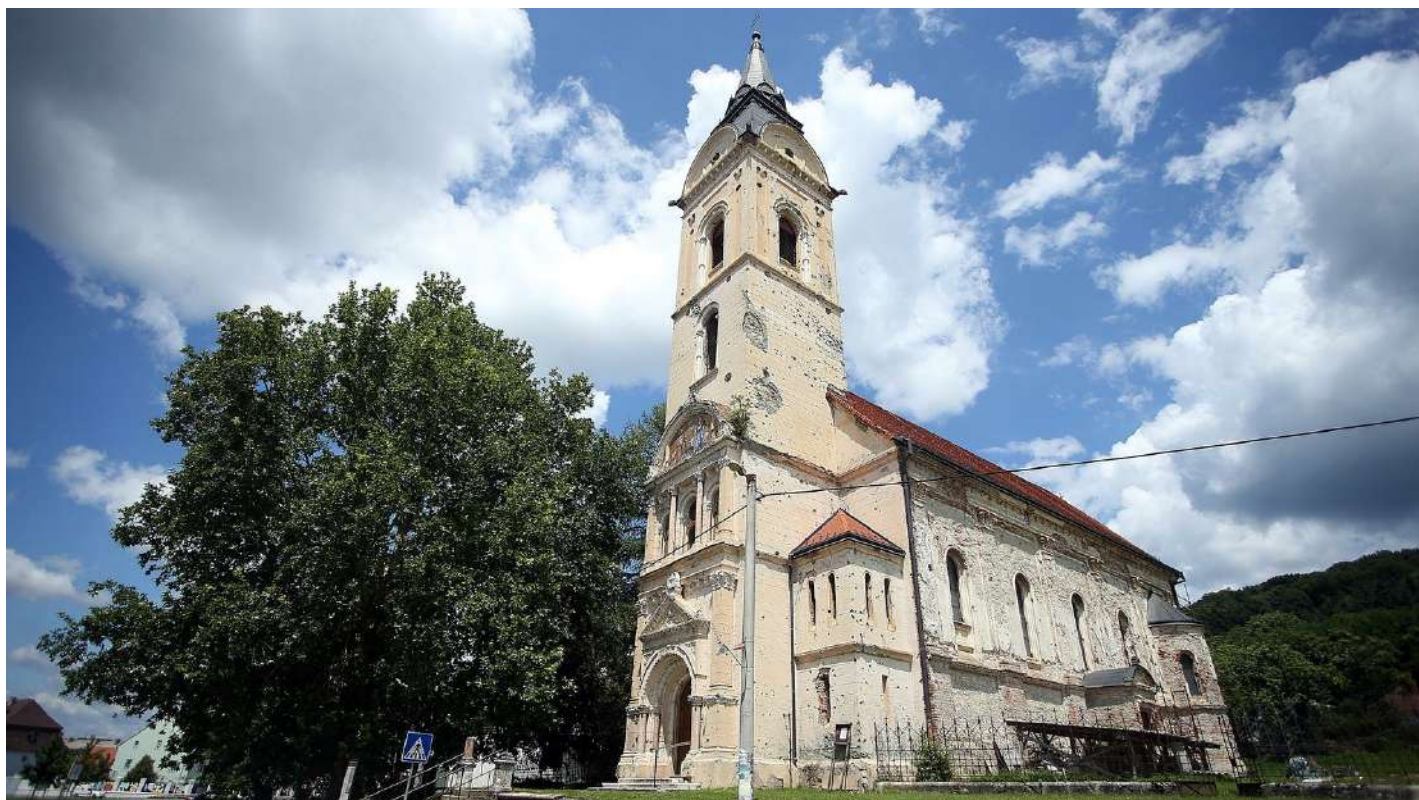
Saborna crkva Svete Trojice, Pakrac.

„Tačno je da moderno doba nosi razne vrste ometenosti koje čoveka potencijalno mogu da odvoje od Boga, ali treba uzeti u obzir da nikada nije ni postojalo ‘idealno vreme’ kako za život ljudi, tako ni za život Crkve“, kaže episkop dalmatinski Nikodim