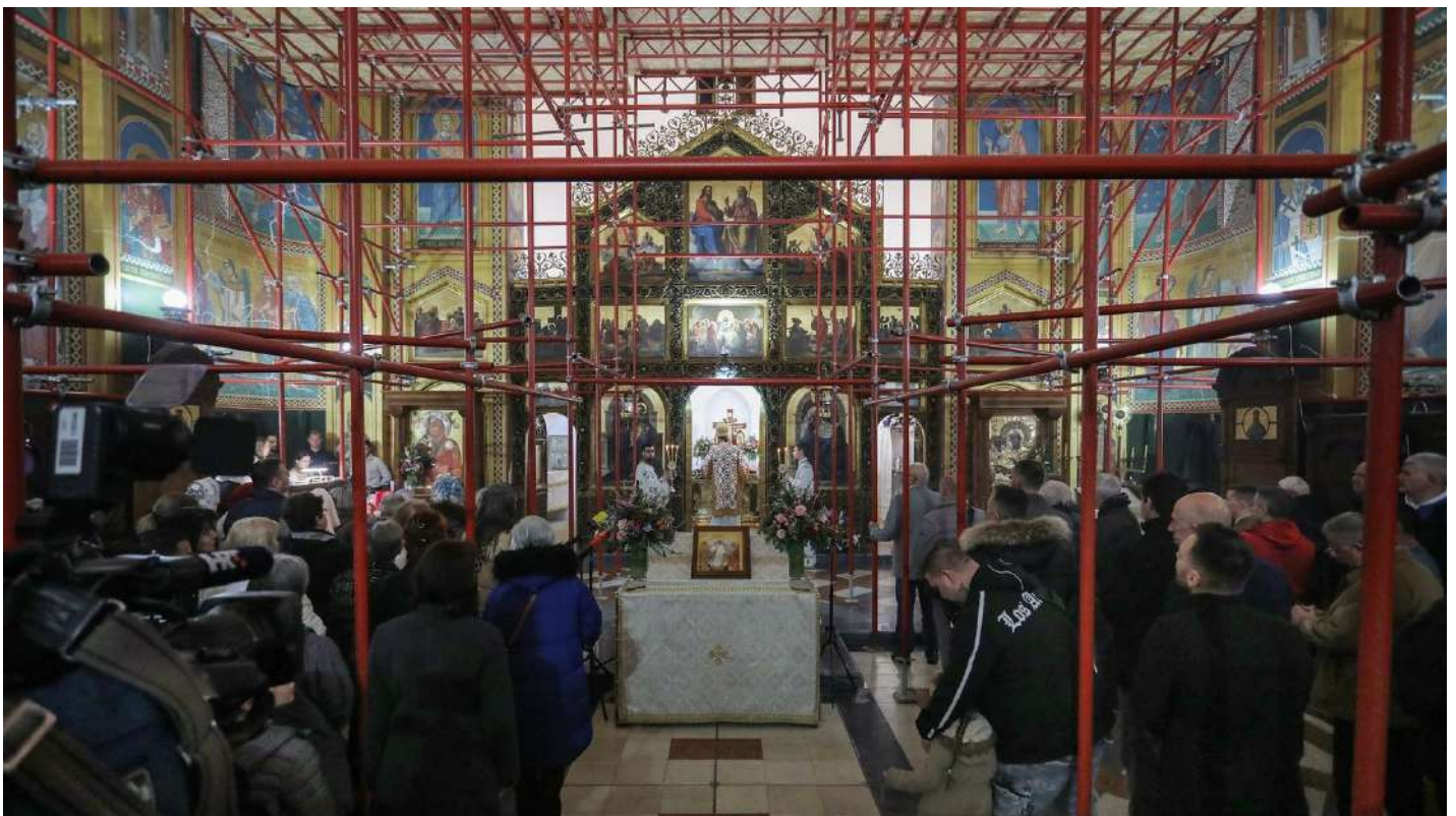
Liturgija u hramu Preobraženja Gospodnjeg na Cvjetnom trgu u Zagrebu

U drugom velikom gradu, u Beogradu u Srbiji, trenutno traje proces postavljanja velikih mozaika u katedralnoj crkvi Beogradske nadbiskupije, koji je financiran iz budžeta grada. Mozaike će izraditi i postaviti slovenski kipar Marko Rupnik , jedan od najboljih svjetskih umjetnika s područja sakralnih mozaika. Kako će mozaik znatno ukrasiti zidove i fasadu na katedrali i većim dijelom će biti postavljen i na zvoniku, tako će on u glavnom gradu Srbije biti nadaleko vidljiv.