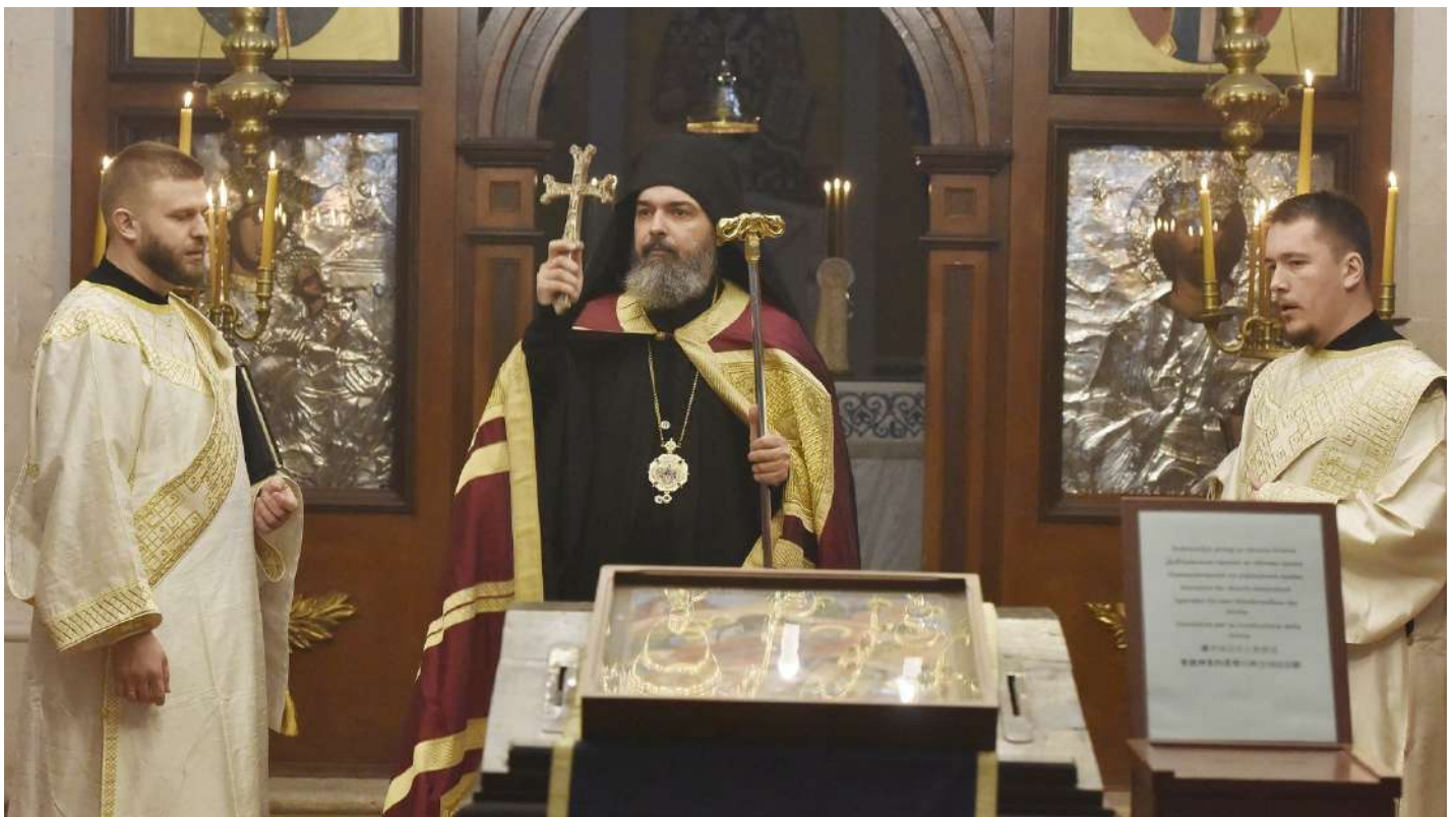
Vladika Nikodim na u pravoslavnoj crkvi u Šibeniku.

...vrijeme misa iskusne jač prognozanja, egzodusa i izbjegništva. I jedni i drugi vjernici pokušavaju u svakodnevnom životu, kakav on već danas jest, živjeti duhom tolerancije, solidarnosti ili bar trpeljivosti prema drugome, što je upisano i u temeljima vjerovanja i katolika i pravoslavaca. Ili, kako kaže episkop dalmatinski Nikodim : „Tačno je da moderno doba nosi razne vrste ometenosti koje čoveka potencijalno mogu da odvoje od Boga, ali treba uzeti u obzir da nikada nije ni postojalo 'idealno vreme' kako za život ljudi, tako ni za život Crkve.“