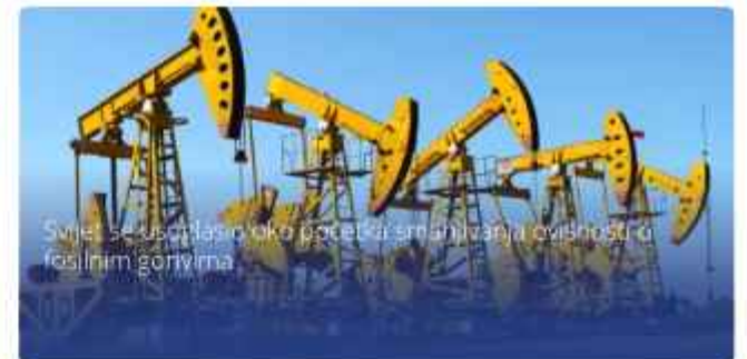
Svijet se susrećao oko početka smanjivanja ovisnosti o fosilnim gorivima