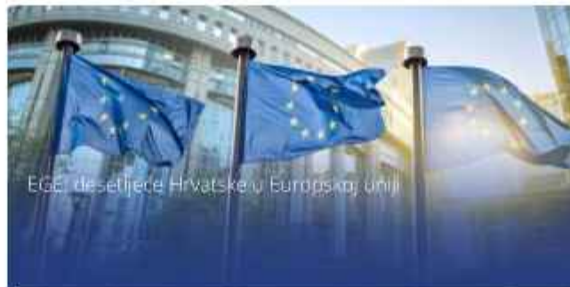
EGE i desetljeće Hrvatske u Europskoj uniji