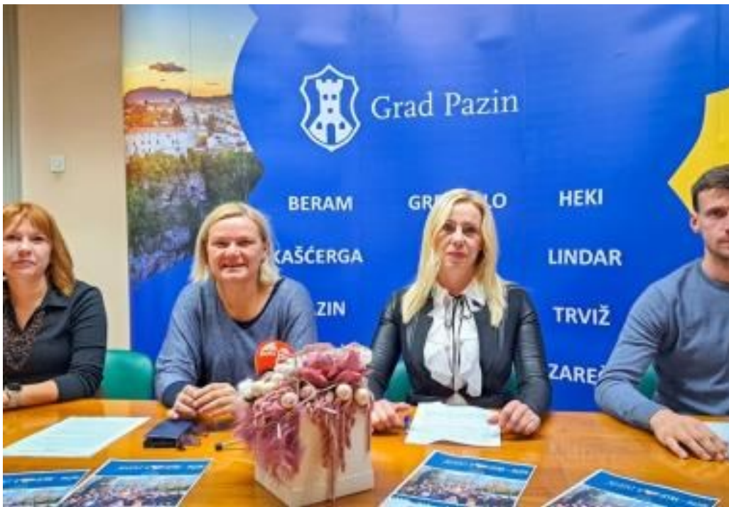
PASAJ, FERMAJ, KALMAJ! Predstavljen "Advent u srcu Istre" – nudi pregršt prilika za druženje i zabavu svim generacijama