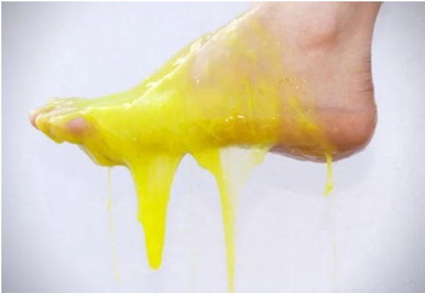
Gljivice na noktima? Uklonite ovaj problem iz svog života jednom zauvijek