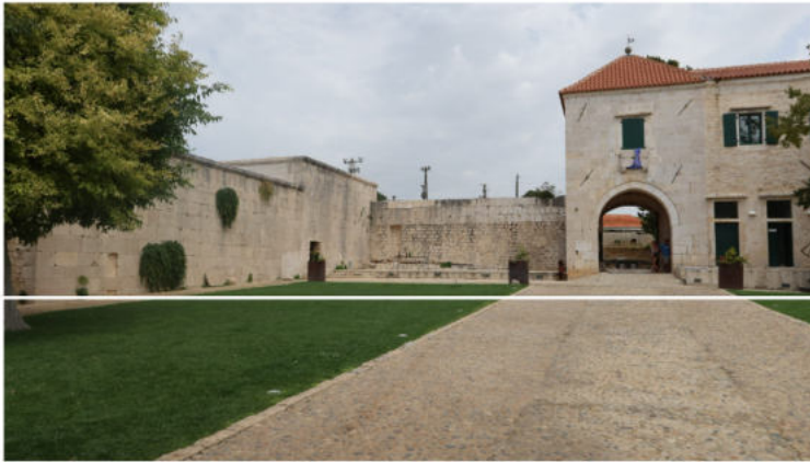
Maškovića Han

Jedan od osnovnih razloga kod raskoraka u vremenu najave i vremenu realizacije, osim kontinuiranih iscrpljujućih sudskih sporova i posljedično nedokazanog vlasništva, je svakako bilo to što EU nije dala novac za opremanje interijera i pripreme radove. Za to je onda općina potegnula u džep HBOR-a te tako isfinancirala potrebno. Kako je cijeli projekt bio orijentiran prema maksimalnom korištenju lokalnih resursa, tako je za opremanje angažirana tvrtka iz Pazina. Naposljetku se sveukupni iznos utrošenog novca od začetka ideje o obnovi do otvaranja hotela za svoje prve goste popeo na četiri milijuna eura.