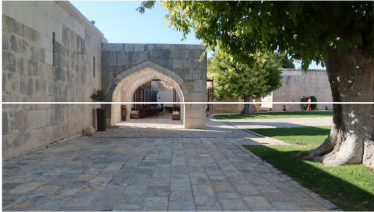
Malinkovića Han

Iako više nije na granici nekadašnjih carstava, i dalje je smješten na sjecištu puteva. Zemljište na kojemu je han je u sklopu Parka prirode Vransko jezero u kojemu je auto-kamp, a Pakoštane, ljeti izrazito posjećeno turističko mjesto, su na nekoliko minuta vožnje automobilom. Iako još uvijek zapuštena, utvrda Vrana privlači ljubitelje povijesti i nasljeđa, a nalazi se svega nekoliko minuta pješice od hana. Tu su još i brojna arheološka nalazišta, koja osim u hanu i Vrani, nalazimo i drugdje u neposrednoj okolici. Tako imamo Gradinu, Pečinu, ostatke rimske vile... Upravo je brojnost arheoloških nalazišta bila jedan od faktora kada se pripremao projekt obnove. Naime, mimo turističke sezone, han je trebao pružiti smještaj arheolozima i ostalim stručnjacima koji dolaze vršiti istraživanja na ovom području.