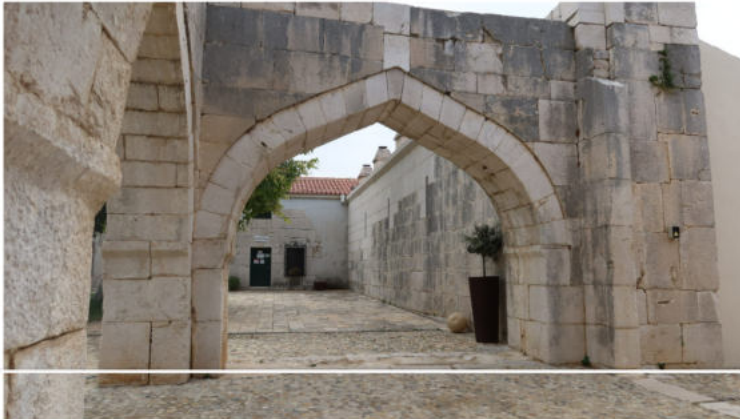
Maškovića Han