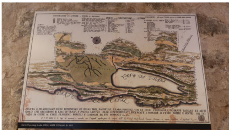
Vranski feud / Maškovića Han FOTO: A.M. / Blaga & misterije

Uz baštinski hotel su vezani dodatni sadržaji poput recepcije i wellnesa, a u sklopu kompleksa su još i uredi turističke zajednice i Agencije Han Vrana. Ujedno, mjesto je to gdje se redovito održavaju različiti kulturno-umjetnički programi nadahnuti baštinom tog kraja.