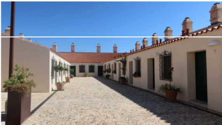
Maškovića Han

Heritage hotel je obnovljen tako da su u sobama zadržani arhitektonski elementi nekadašnjih konaka poput komina i puškarnice te kamenih zidova. Hotel ponosno nosi svoje 4 zvjezdice te raspolaže s 14 dvokrevetnih soba i dva apartmana s ukupno 34 ležaja. Kao i u restoranu, u kojemu je gostima osiguran doručak nakon noćenja, i u hotelu je namještaj minimalistički i moderan. Wellnes & spa su smjestili uz hamam pa i to nude kao dodatni sadržaj svojim gostima.