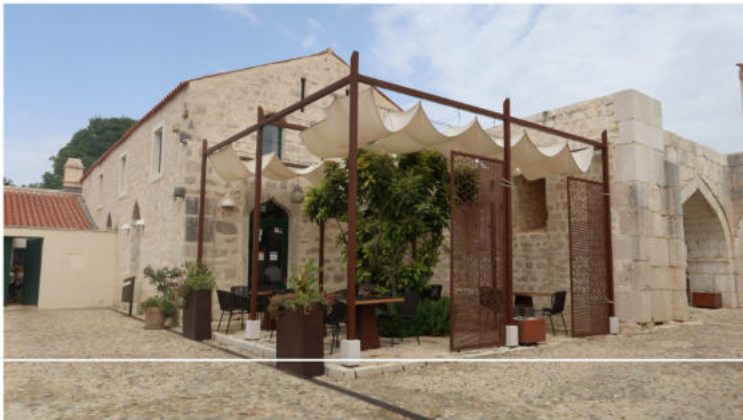
Maškovića Han

svoj restoran smješten u nekadašnjoj džamiji u sklopu hana te hotel baština smješten na mjestu nekadašnjih konaka.