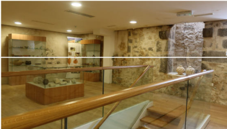
Maškovića Han

Paralelno s obnovom, događala su se i brojna arheološka otkrića koja su ju usporavala. Naime, pri svakom otkriću, nužno je zaustaviti radove, te pažljivo obraditi i valorizirati nalazište, prema strogim načelima arheološke struke, pod nadzorom nadležnih Konzervatorskih odjela. Kako ih je Maškovića han skrivao nekoliko, nalazim i to kao valjan razlog kašnjenjima. Ostali predviđeni sadržaji obnovljenog hana su otvoreni za javnost 2018.