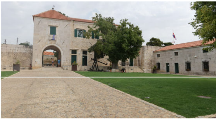
Maškovića Han

Slični izazovi inače prate bilo kakav projekt obnove kulturne baštine u Hrvatskoj. Priča o hanu s kojom je javnost upoznata počinje 2013. godine najavom projekta pod nazivom "Obnova Maškovića hana i gospodarska revitalizacija mjesta Vrana", financiranog u sklopu europskog pretpripravnog fonda za Hrvatsku- IPA 2009.