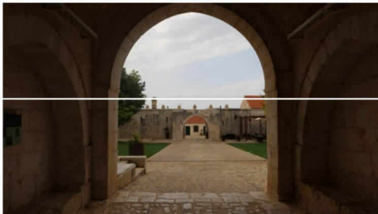
Maškovića Han