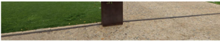
Maškovića Han