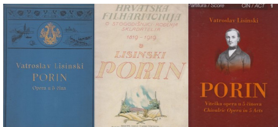
Porin izdanje iz 1901., Porin izdanje iz 1919. i MIC izdanje Porina iz 2011.