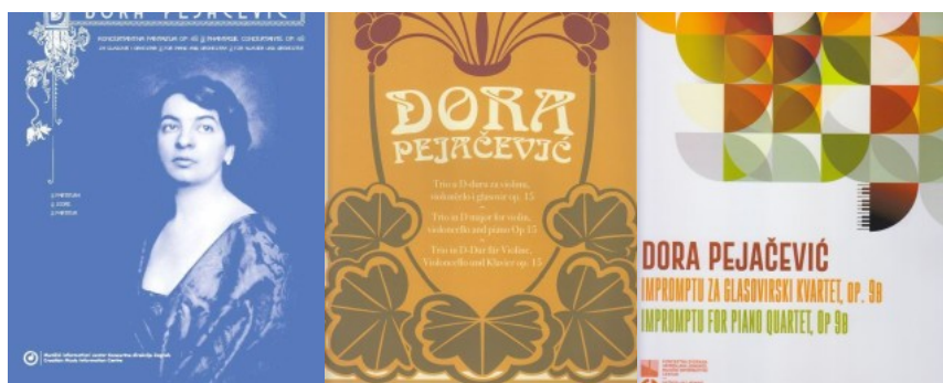
MIC izdanja Dore Pejačević