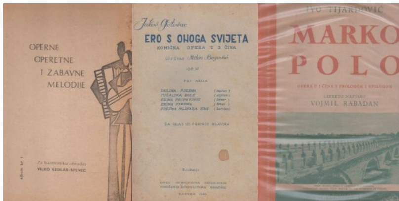
Operne, operetne i zabavne melodije album br. 1