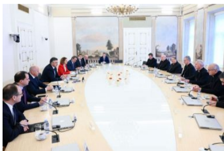
Sastanak Vlade RH i Stalnog vijeća HBK

Još iz rubrike: Istinito, lijepo i dobro