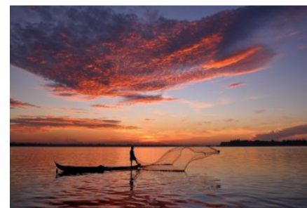
"Hajdete za mnom, učinit ću vas ribarima..."