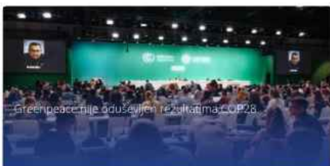
Greenpeace nije oduševljen rezultatima COP28