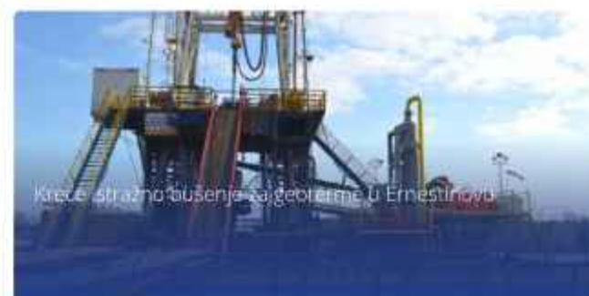
Kreće istražno bušenje za geotermu u Ernestinovu