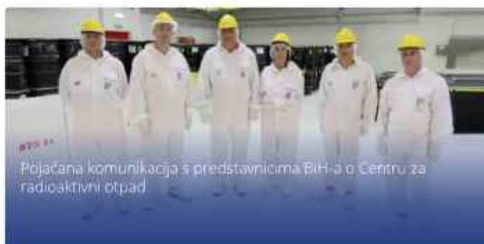
Pojačana komunikacija s predstavnicima BiH-a o Centru za radioaktivni otpad