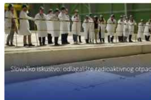
Slovačko iskustvo: odlagalište radioaktivnog otpada