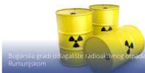
Bugarska gradi odlagalište radioaktivnog otpada na granici s Rumunjskom