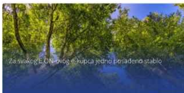
Za svakog E.ON-ovog e-kupca jedno posađeno stablo