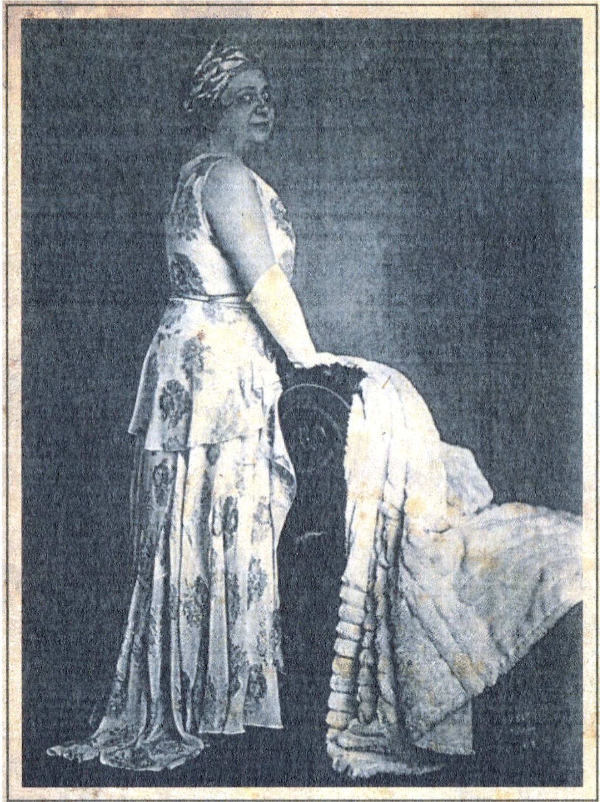
„Ja sam prije svega bila i ostala novinar“ – rekla je o sebi Marija Jurić Zagorka. Snimljena je na novinarskom balu 1931. u hotelu Esplanade.