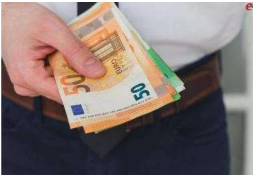
U Ludbregu kreće isplata socijalne pomoći umirovljenicima i osobama slabijeg imovnog stanja, evo rasporeda