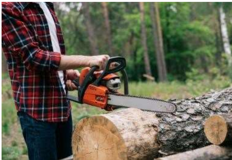
Lopov iz šume srušio i otuđio stablo hrasta lužnjaka, oštetio vlasnicu za 660 eura