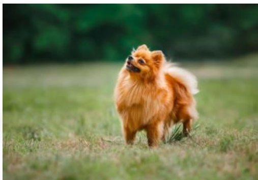
30 naoriginalnijih imena za male pse

I do 9 cm duži, i do 65 min. više. Dovoljna je jedna kapsula dnevno >>