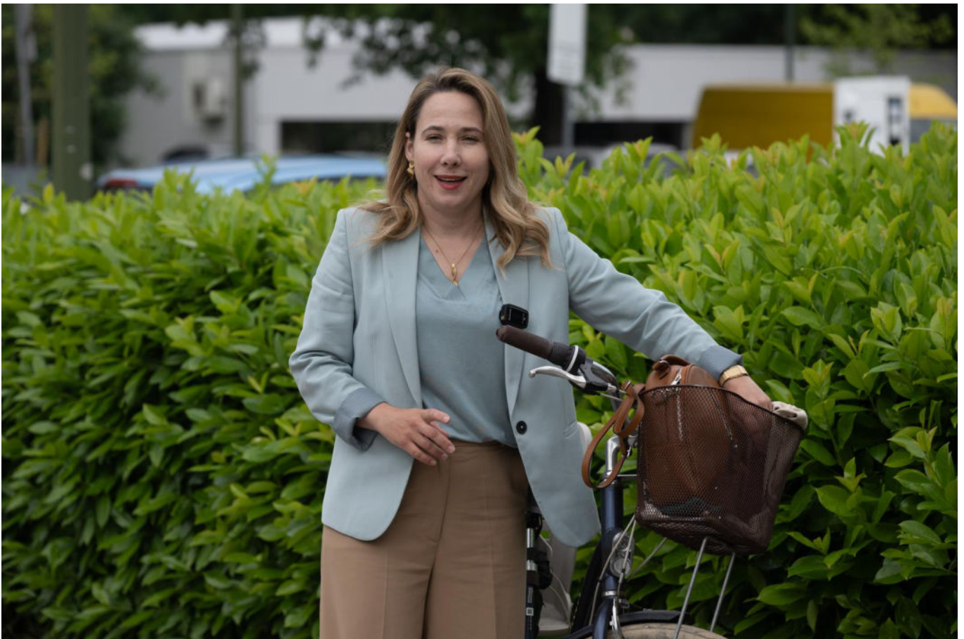
Marija Selak Raspudić

Na Facebook stranicama Telegrama i moje supruge više desetaka žena iznijelo je svoja različita, no uglavnom loša iskustva sa skrbi o svojem ženskom zdravlju. Gotovo da nema osobe koja nije prošla slično mojoj supruzi, ili zna nekoga tko se sudario sa zidom sustavne nebrige o ženskom reproduktivnom zdravlju.